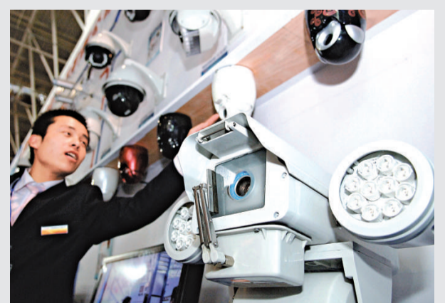
▲第十屆國際公共安全防范產品展覽會在濟南舉行，吸引國內外400多家安防企業參展，圖為參展商在介紹一款公共安全防范產品

晚間8時44分，當火車快到期時，唐沖洋將身上爆炸裝置的導火線點燃，企圖炸毀貨物列車。火車司機發現後，鳴笛並採取緊急應付措施。所幸爆炸裝置故障未能引爆，唐沖洋被聞訊趕來的鐵路警察逮捕。這次事故造成火車行車中斷20分鐘。