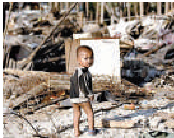
▲2010年內地徵地拆遷問題，成為最受網絡輿情關注的問題之一，尤其是地（級）市縣拆遷矛盾最為突出

【本報記者韓毅重慶二十四日電】2010中國網絡輿情指數年度報告今日在重慶發布，徵地拆遷、反腐倡廉、涉警形象成為去年網絡輿情中關注度最高的三大問題。