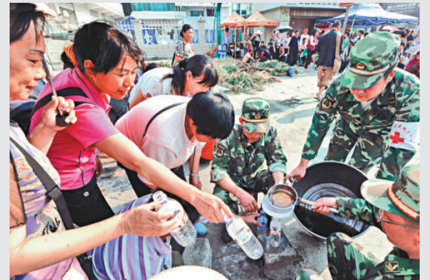
▲雲南盈江「3·10」地震發生後，德宏州公安邊防支隊臨時醫療站的醫務人員，每天為災區群眾準備幾大鍋預防感冒、腹瀉及病毒感染等疾病的中草藥湯，受到群眾歡迎