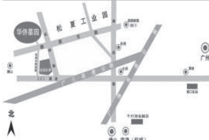
華僑墓園路線示意图

班次1：太子0745、荃灣0810 班次2：太子0815、荃灣0840、屯門0900 班次3：太子0915、銅鑼灣0845、荃灣0940、西灣河0830 班次4：太子1215、荃灣1240、屯門1300