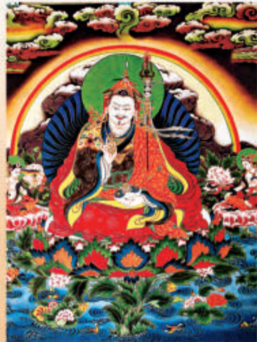
▲唐卡畫《蓮花生大師》