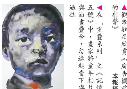
▲觀眾駐足欣賞《廣告欄前的射擊》