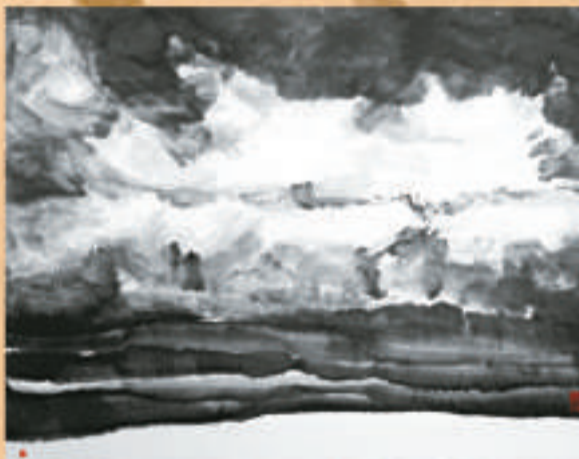
▲孫廣義筆下的雲南風光

中國畫家孫廣義的個人畫展正在 Sin Sin Fine Art 舉行至本月三十一日，展示他由二〇〇四至二〇一〇年的作品。