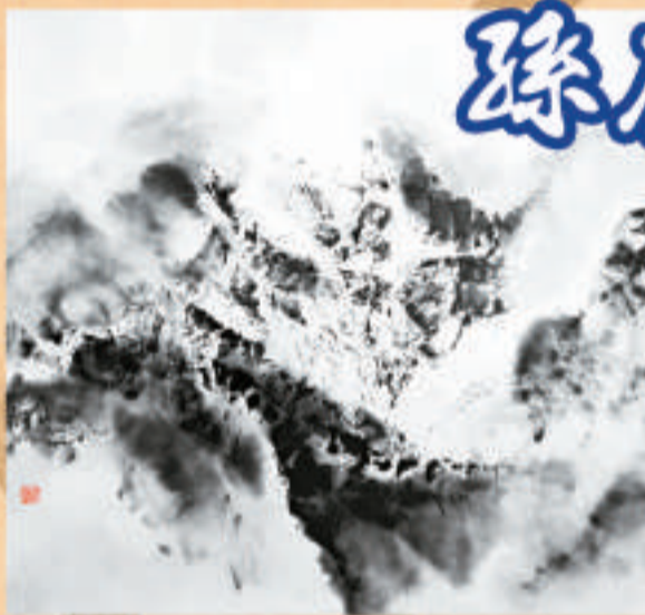
▲回歸香格里拉——天界