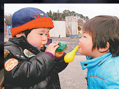
▶一些孩子還不知道自己可能已經成了孤兒

孫正義22日和福島縣知事舉行會談，擬推動該縣災民向其他縣轉移相關事宜。自3月11日日本東北部發生大地震後，孫正義在地震發生後立即宣佈，從3月11日起的一周內，凡日本國內通話，無論時間長短，一律免費。軟銀在日本東北地區的手機基站中有617個無法使用，孫正義稱正全力進行搶修。（《朝日新聞》網站）