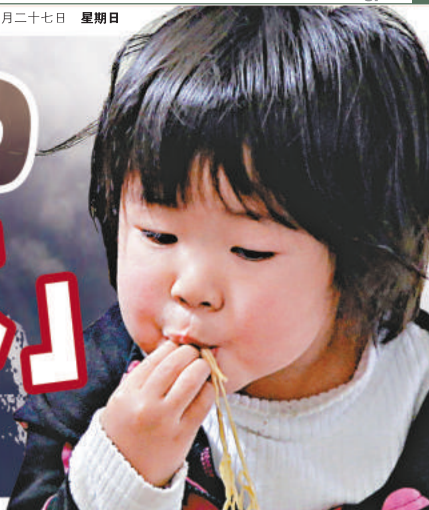
▲孩子們在簡陋的避難中心吃飯