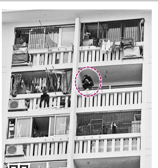
▲單親母親抱同年僅三歲兒子攀出十五樓欄杆危坐（紅圈示）

另一宗火警現場為上水祝運街上水層房對開。昨日凌晨二時許，上址路旁一批竹枝突然離奇着火焚燒，火勢非常猛烈，迅速蔓延至附近雜草，火場面積一度約十米乘十米。消防員接報趕至動用兩條滅火喉和兩隊煙帽隊進行撲救，直至凌晨三時許始將火勢撲滅。消防員初步調查發現起火原因有可疑，警方列作縱火案處理。