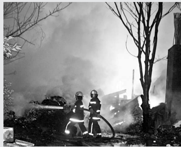
▲消防員趕往丹桂村鐘車工廠，包圍火場射水撲救