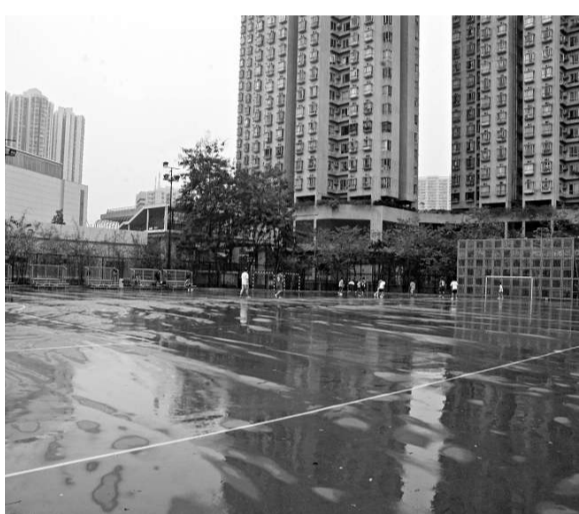
▲肇事青衣公園足球場 ▼男死者屍體由件工昇走

警員接報趕至封鎖現場，由消防員開啓救生氣墊戒備，期間警員及消防員登上十五樓進行游說，只見黃婦表現激動，並不時大哭大叫，狀甚危險。消防員及警員遂一方面不斷好言相勸，一方面則慢慢移近母子危坐欄杆位置，雙方對峙約半小時，消防員及警員趁黃婦低頭凝望兒子不察之際，乘其不備一擁而上合力將母子拉回走廊安全地方，雖然黃婦一度不停掙扎尖叫，但經勸喻情緒略為平服後，母子由救護車送院檢查，大團圓結局。