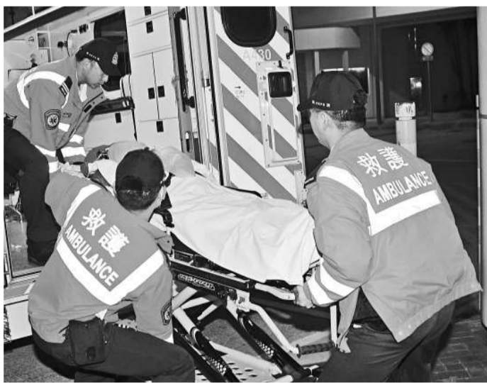
▲墮樓內地男校長由救護車送院後不治 ▲肇事香港華人基督教聯合真道書院

昨日真道書院在接受傳媒查詢時，證實一名由內地到該校作交流的訪客被發現墮樓身亡，並稱該名訪