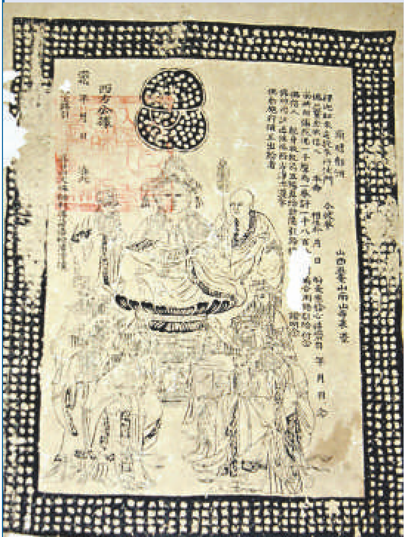
洛陽民俗博物館徵集到明代佛教「路引」文憑

硃墨為文房高階用品，備受喜愛，有「珠玉不如」的美譽，若製為套墨、集錦墨，更是收藏家的寵珍。