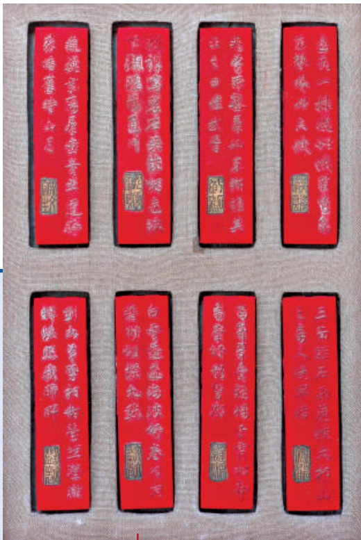
「新安大好山水」硃墨

●刺股 面刺股動讀圖，背題句「刺股終邀錦繡榮」。戰國蘇秦，青少年時晝夜勤讀，至深夜入眠，引錐刺股（大腓），使醒又讀。後佩六國相印，曾衣錦返故里。 ●雞窗 面窗前雞鳴圖，背題句「聊向雞鳴參妙義」。雞，家禽，有報曉之聲，使人知天之將明而早起。雞物類耳，尚且有功於人，人生在世，安能虛度，無益於世？參透此義，人自能發奮圖強，努力向上，建功立業，奉獻社會。 ●鄴架 面讀書萬卷圖，背題句「還披鄴架考遺文」。唐宰相李泌，歷輔玄、肅、代、德四朝，一代名相，以功封鄴侯。生平好讀書，多藏書，人稱其藏書之所為「鄴架」。韓愈有詩云：「鄴侯家多書，插架三萬軸。」後人楹聯云：「鄴架圖書三萬卷，函關道德五千言」。李泌的事迹，足以策勵青年博覽群籍，汲取知識，成就繁榮大才。