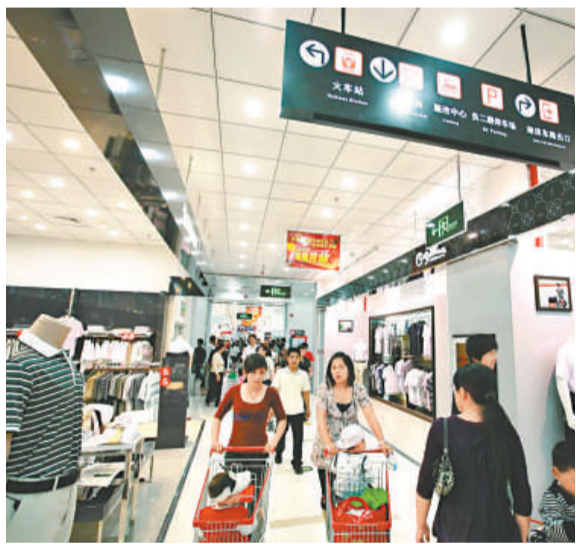
廈門梧村地下商業街

今年是「十二五」開局之年，全省上下都在持續實施「五大戰役」，思明區將按照省、市有關精神，心無旁騖、凝心聚力推動「五大戰役」進度再加快、戰果再擴大、效益再提升，加快推進思明科學發展新跨越。重點項目建設戰役方面，將全力抓好16個市級、69個區級總投資30億元以上的重點項目建設，積極推動香格里拉大酒店、冠音泰科技等20個新建項目啟動建設，力促匯金國際中心、福達里改造、二輕大廈等21個項目按期竣工。新增長區域發展戰役方面，着重抓好會厝安片區改造等8個新增長區域項目8.16億元投資，推動第一批62個經濟增長點項目實現4.63億元財稅收入。城市建設戰役方面，將投入9億元實施南普陀片區等交通改善工程；完善數字化城管系統功能，進一步提高城市管理水平；對有條件的老舊住宅小區實施改善工程；繼續推動環衛一體化建設，加強公廁建管，強化市容管理；推進「四線」工程建設，做好主次幹道美化彩化，建設街頭綠化小景和社區公園，新增園林綠地15公頃；配合做好開置鐵路沿線景觀改造等。民生工程戰役方面，將投入近2億元實施包括繼續創建10個安靜居住小區、新增3所公辦幼兒園、建設區青少年校外體育活動中心等14類項目建設，為構建「幸福思明」打下堅實基礎。