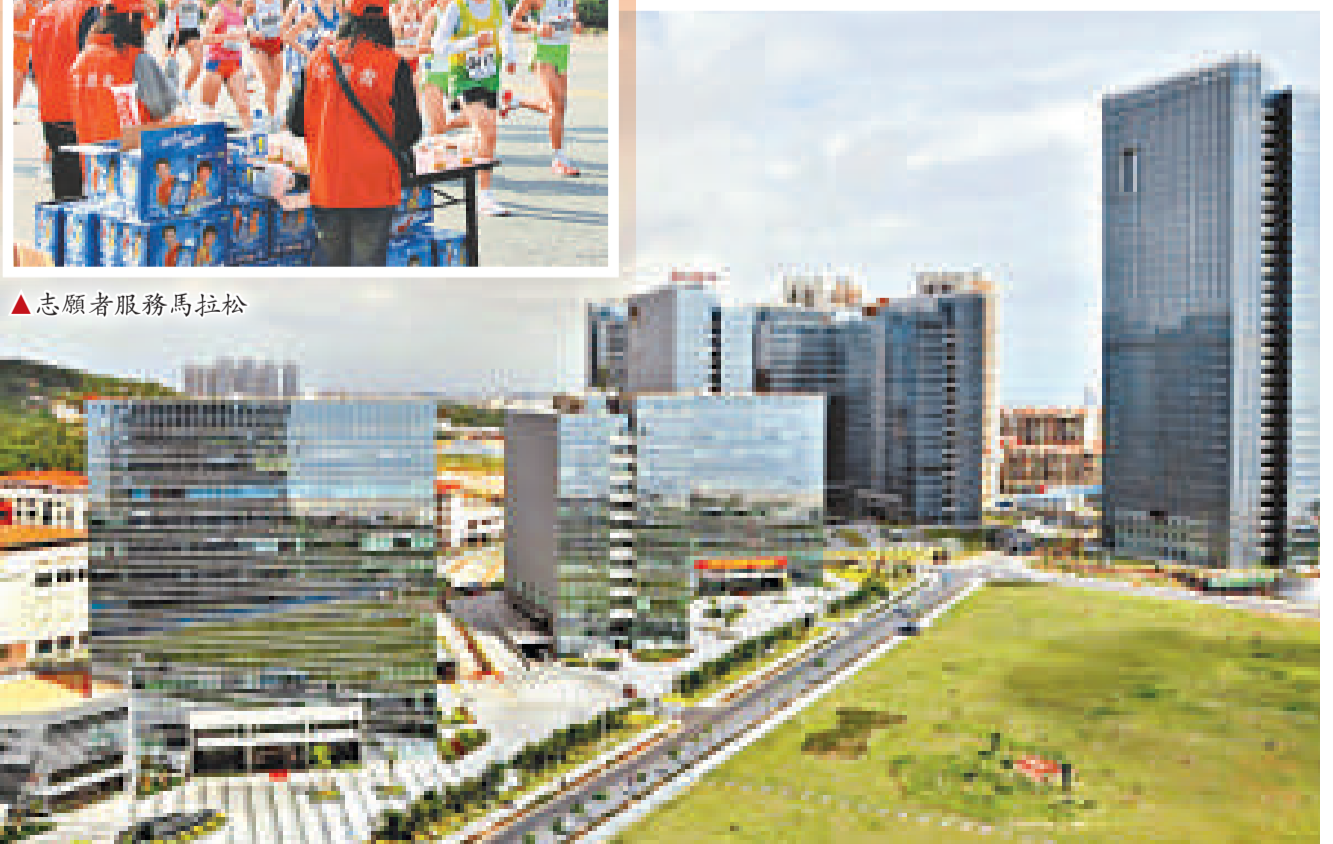
觀音山國際商務營運中心

對照省、市要求，結合思明區實際，思明區提出了力爭到2015年實現地區生產總值和財政收入翻一番，構建「宜居、宜學、宜遊、宜商、宜業」的「五宜」城區，努力打造居民更加富裕、社會更加和諧、生態更加優良、文化更加繁榮、生活更加舒適的「幸福思明」的目標。「十二五」期間，思明區將積極推動重大項目生成落地，重點推進總投資885億元的188個項目和十大片區建設；以「7+1」產業集群（產業鏈）培育為重點，促進產業延伸並向高端化發展，培育一批年銷售收入超十億元的龍頭企業和超百億元的產業集群；積極推動兩岸區域性金融服務中心建設，爭取在更高層次、更廣領域、更大空間上參與兩岸區域合作；加大投入完善基礎設施配套，努力解決好交通擁堵、停車難等城市突出問題；加強生態環境保護，力爭綠化覆蓋率超過45%，環境空氣質量優良率達到98%；突出以人為本民生優先，確保九年義務教育人口覆蓋率100%，人均預期壽命達到78.8歲，居民最低生活保障全覆蓋，居民人均可支配收入達4.5萬元；提高市民素質和社會文明程度，讓城市生活更美好！