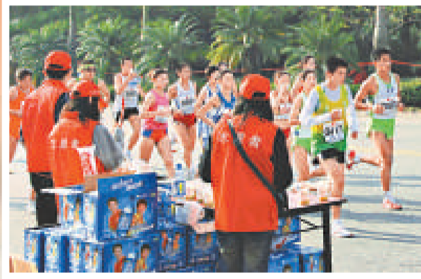
志願者服務馬拉松