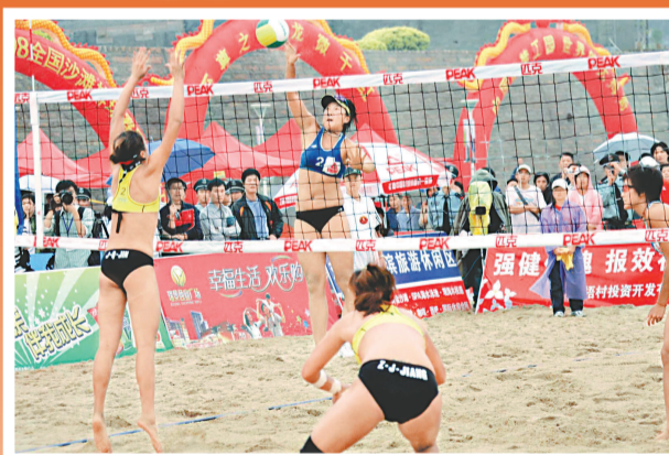
全國沙灘排球錦標賽每年在思明區舉辦