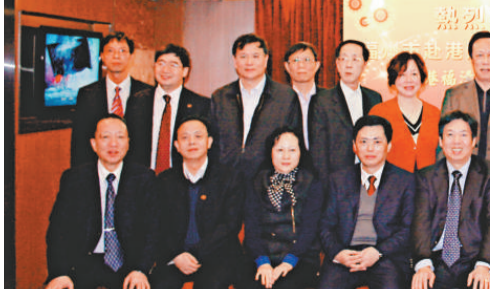
▲福清同鄉會宴請家鄉經貿代表團

【本報訊】記者黃閩報道：香港福清同鄉聯誼會日前假上環賽馬會黃金閣歡迎福州市赴港經貿代表團一行。出席晚宴的嘉賓包括福州市委常委、市委秘書長徐啓源，市委副書記、福州市委書記陳大強，福州市副市長陳為民，華格公司董事長戴秀芳等。該會理事長林宏榮、監事長許經流及香港福建社團聯會副主席楊伯淦在場熱情迎迓，賓主雙方歡聚一堂，開懷暢談家鄉一日千里的發展情況。