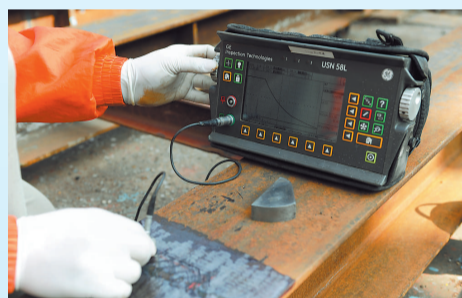
使用超聲波儀器檢驗焊接位置

梁漢泉表示，所有與鋼結構有關的建築，建造時都需要驗焊，例如橋樑、鑽油台、陸上及海底管道、化工廠、船舶、發電站、火車軌道等，涉及的範圍極廣。由於鋼結構產品的特性，如果焊接接頭存在缺陷或因焊接而導致材料本身出現問題，就有可能造成結構斷裂，甚至引起重大事故，因此焊接檢驗非常重要。