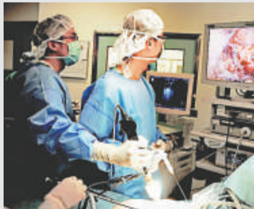
醫生為肝癌病人進行微波消融手術