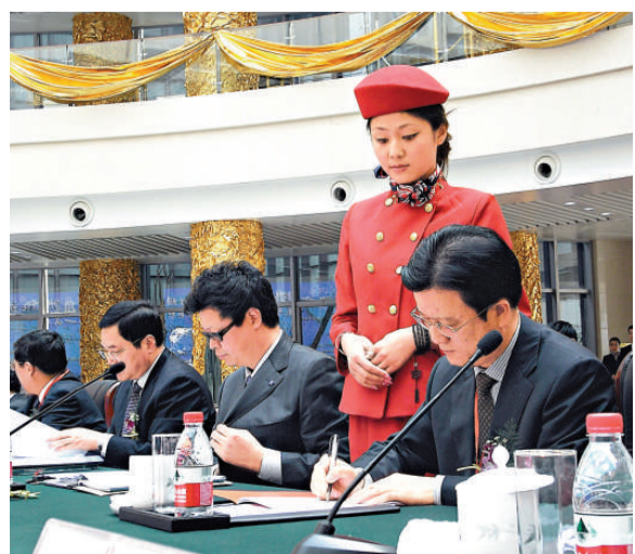
▲長三角22位市長簽署《長江三角洲地區城市合作（鎮江）協議》

【本報記者陳昱鎮江一日電】長江三角洲城市經濟協調會第十一次市長聯席會議今天在江蘇鎮江市召開，長三角22位市長與部分著名企業家以「高鐵時代長三角城市群合作」為主題就長三角城市群的發展定位與加大合作力度進行協同商議，圍繞城市群合作重點領域，確定了開展2個合作專題與9個合作課題研究。