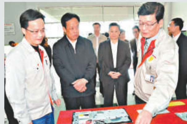
▲東莞市長李乾全（左二）前往日資企業先鋒高科技公司調研生產經營情況

為加快保障房建設，廣州市日前將保障房建設資金在土地出讓淨收益中的提取比例從10%提升到13%，並對保障房用地做到「應保盡保」