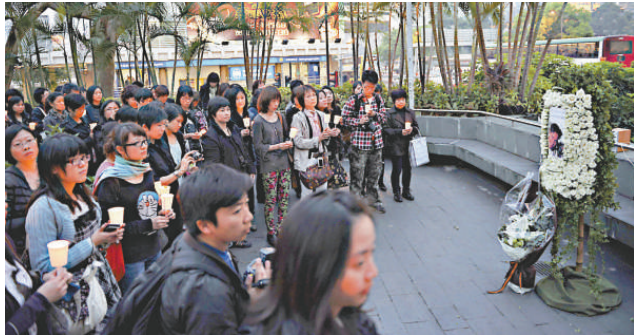
▲文華酒店，聚集粉絲悼念