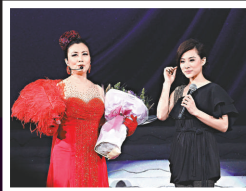
▲阿姐糾正劉璇廣東話，全場搞笑

一連三場的《鄭少秋、汪明荃、喜多郎新紀元2011演唱會》前晚在紅館舉行，二人大唱經典電視主題曲，秋官更直言阿姐是他其中一個最敬佩的藝人，教阿姐開心不已，阿姐亦笑言和秋官合作不敢輕敵，因他好勤力，她不可以落後於他。當晚劉璇上台獻花給阿姐，自稱自小已看阿姐的演出，更與阿姐合唱一曲《萬水千山總是情》。