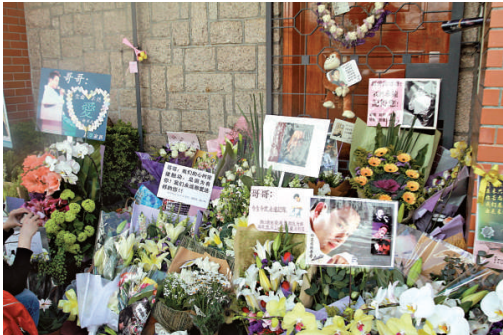
◀因歲月流逝 ▶粉絲懷念哥哥，不