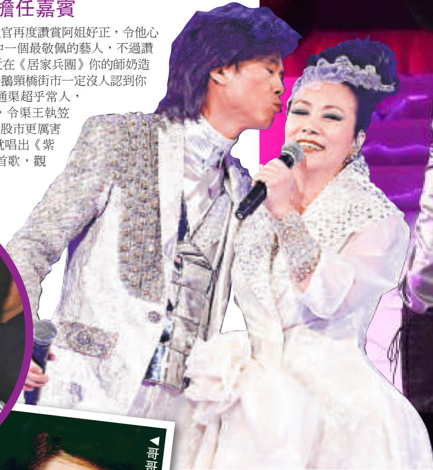
▲秋官同阿姐如歡喜冤家 ◀秋官讚阿姐靚，好想親一親