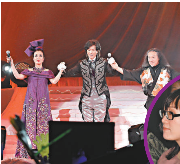
▲秋官、阿姐及喜多郎齊為災民打氣 ▶欣宜台下撐父親

及至演唱會尾聲時，秋官再度讚賞阿姐好正，令他心跳加速，又指阿姐是他其中一個最敬佩的藝人，不過讚完後又取笑阿姐道：「最近在《居家兵團》你的師奶造型似到十足十，相信捉你去鵝頸橋街市一定沒人認到你，你那一幕單手插入屎坑通渠超乎常人，帶領所有師奶都自己通渠，令渠王執笠。」阿姐就笑指秋官能影響股市更厲害。到安哥時，阿姐與秋官就唱出《紫釵記》及《圓月彎刀》兩首歌，觀眾這才肯離場。