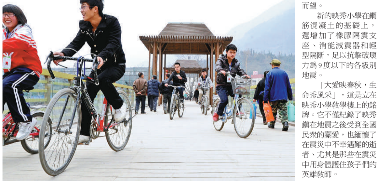
▲四川省汶川縣的映秀鎮重建後充滿溫情，生機勃勃

「大愛映春秋，生命秀風采」，這是立在映秀小學教學樓上的銘牌。它不僅紀錄了映秀鎮在地震之後受到全國民衆的關愛，也緬懷了在震災中不幸遇難的逝者、尤其是那些在震災中用身體護護住孩子們的英雄教師。