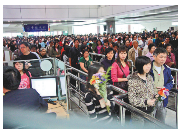
▲港澳居民在清明時節紛紛北上回鄉祭祖，圖為拱北口岸出現手持鮮花祭品的人流

【本報記者方俊明廣州四日電】清明假期，廣東居民以及部分港澳人士、海外僑胞紛紛回鄉祭祖，高速公路的車流量較平日激增近3成；其中往粵東、粵西兩翼的路段車流量增長尤為明顯，深汕高速擁堵最為嚴重，車龍最長時排了10多公里。