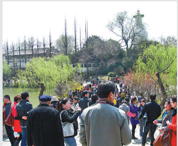
【圖文：本報記者曾媛園 實習記者唐業】

第四屆世界文昌鄉親懇親會三日上午在僑鄉海南文昌拉開帷幕。來自美國、加拿大、德國、日本、新加坡、馬來西亞、印尼和香港、台灣等地的112名文昌籍華僑匯聚一堂，共敘鄉情。