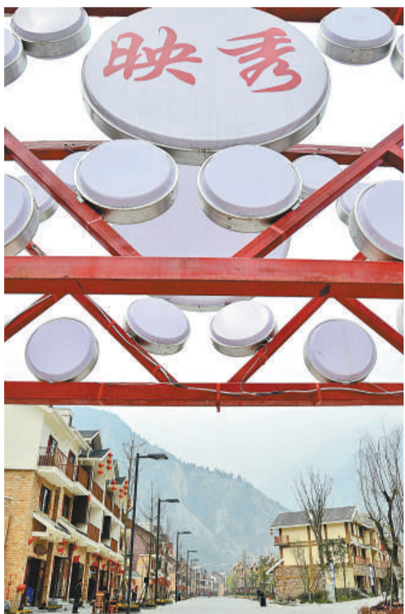
▲四川省汶川縣的映秀鎮重建後充滿溫情，生機勃勃

【本報訊】2008年汶川特大地震發生後，災區重建進展一直受到各界關注。尤其是清明節這個傳統緬懷故人的時節，汶川就會比平時吸引到更多的注意。最近有記者再訪重災區映秀鎮時發現了可喜的景象，「災難的小鎮」變成了「溫情的小鎮」。