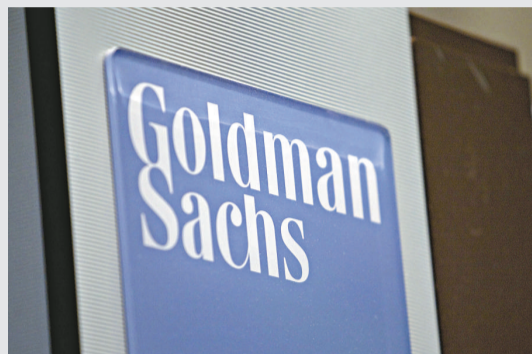
▲高盛強調，正研究解決方案，冀投資者獲得公平對待