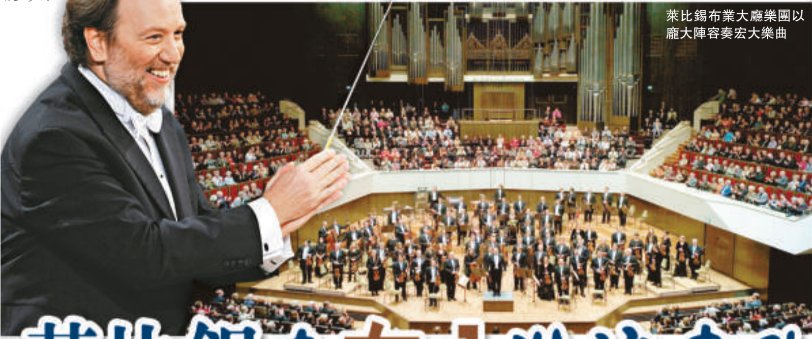
萊比錫布業大廳樂團以龐大陣容奏宏大樂曲