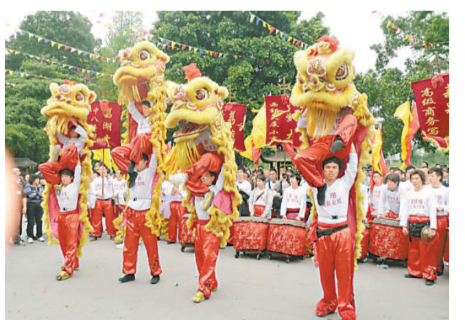
▲仁威廟會醒獅表演 本報攝

【本報記者袁秀賢廣州四日電】今天是一年一度的泮塘仁威廟會，成為「三月三」的核心項目，吸引廣州、佛山一帶醒獅隊參加大巡遊，現場頗為熱鬧。黃飛鴻獅藝表演精彩，把泮塘仁威廟會推向高潮。