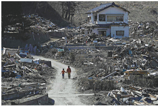
▲岩手縣宮古市遭海嘯肆虐後的慘景

此外，在宮古市吉吉地區的12家住戶也託先祖的福，在海嘯中得以存活下來。在1896年和1933年的兩次大海嘯中，該地區的大部分居民遇難，倖存的居民們在海拔60米的地方立下「別在此處的地方安家」的碑石，還刻下了「高處生活帶來子孫安樂，多防備帶來災難的大海嘯」的句子。後輩人在先祖的警告下，始終選擇比碑石海拔高的地方安家落戶。因此，在上月的海嘯警報響起時，身在港口的居民們迅速趕回家中躲避。