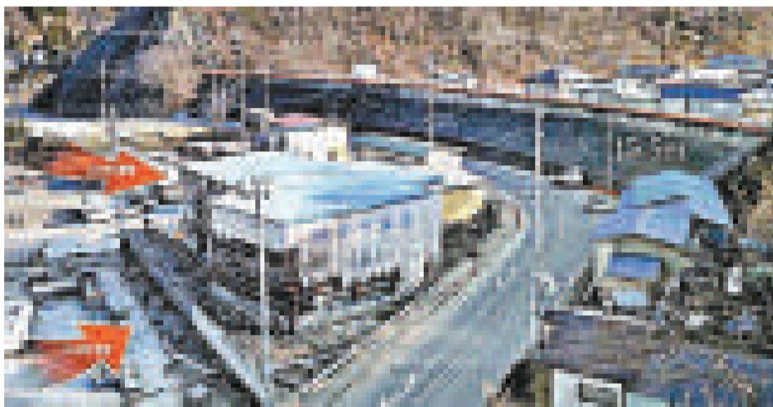
▲日本東北部岩手縣北部普代村遭14米高的海嘯肆虐後的景象；以高15.5米的防潮堤(紅線處)為界，雖然左側港口的設施都被化為廢墟，但另一側的民居安然無恙

據了解，截至4月3日，普代村除了有一名在防潮堤外圍失蹤的村民之外，並無人員死亡。相反，在防潮堤僅有10米高的宮古市，