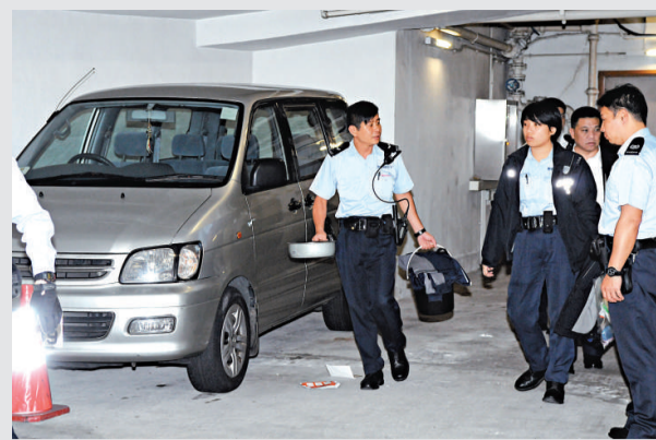
▲警員從車上檢走證物