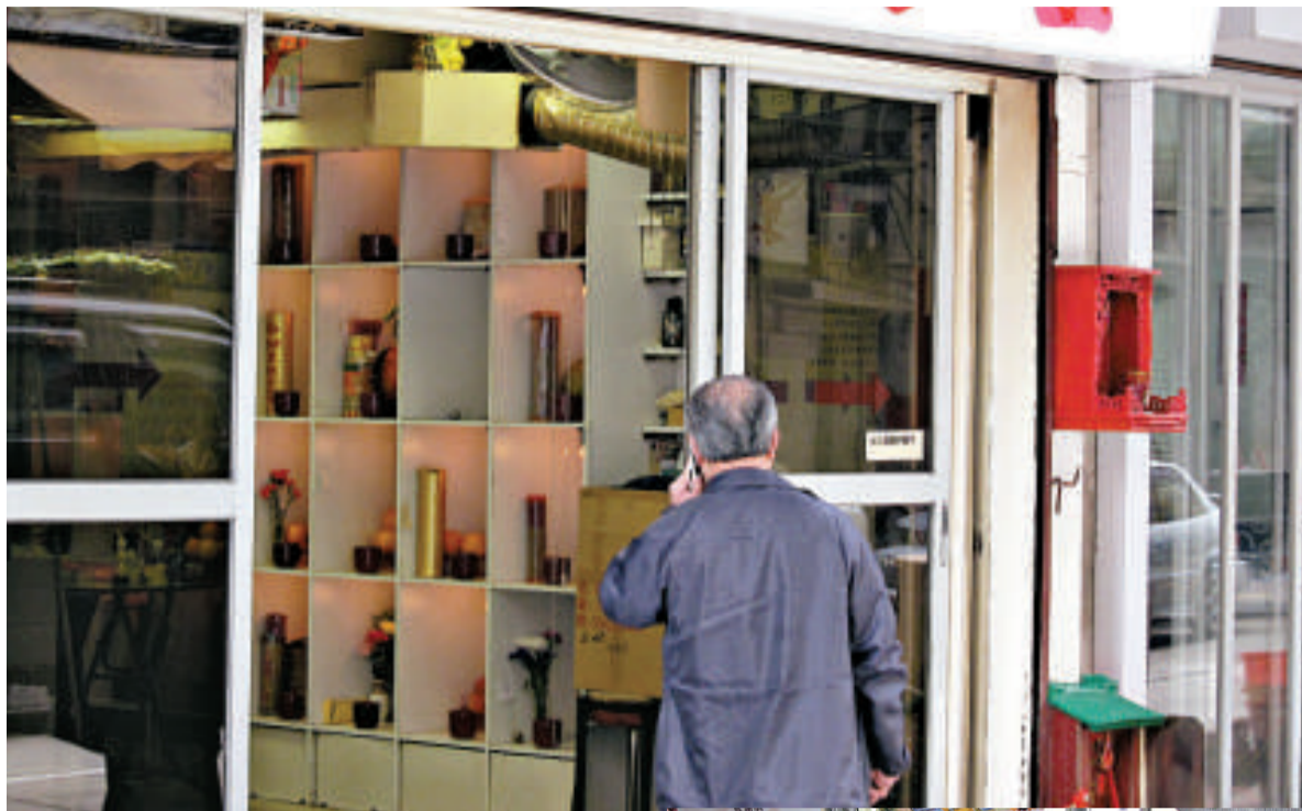
▲長生店存放不少骨灰龕，儼如私營龕場。殯儀業期望當局立例規管私營骨灰龕場時，亦對長生店作清晰指引

發展局現時定期公布及更新違規私營骨灰龕場資料，食物及環境衛生局正研究立法規管事宜。食衛局去年七月提交立法會的文件提出，應透過發牌制度加強規管