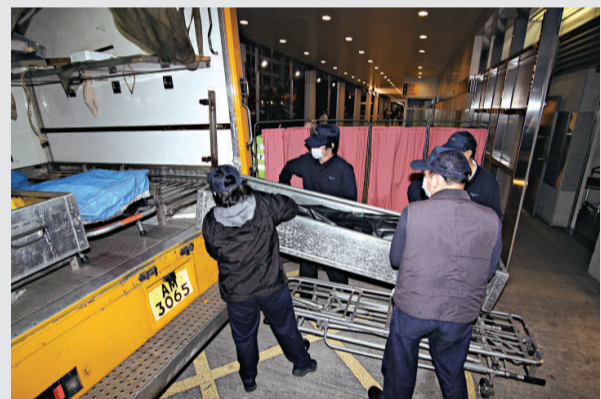
▲屍體由作工昇往殮房，死因有待確定

昨晨約九時，李翁報案稱妻于倒臥廚房地面上昏迷，救護員到場時，她已經呼吸脈搏微弱，送瑪嘉烈醫院搶救證實不治。由於女死者頭部有傷痕，警方擔心事不尋常，由探員跟進調查。警方暫時未能確定她的頭傷是否意外造成，有待法醫剖屍檢查死因。