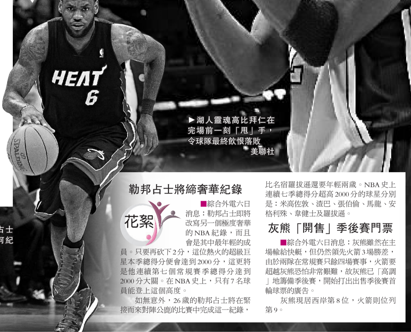
▶湖人靈魂高比拜仁在完場前一刻「甩」手，令球隊最終飲恨落敗

湖人輸波，最高興的莫過於馬刺，該支聯盟成績最佳球隊作客以97：90擊敗雄鷹，現時以59勝19負在西岸領放，只要拿下未來對帝王及爵士的兩場比賽，就肯定能在下周硬撼湖人前提早成為季後賽西岸頭號種子。