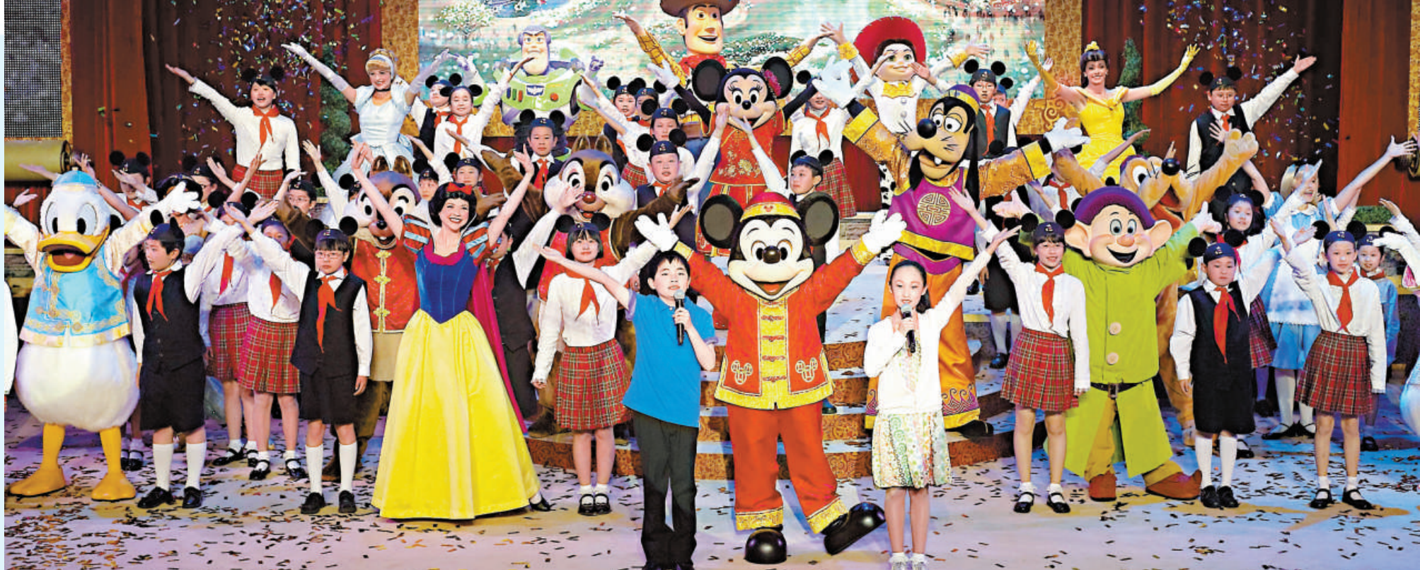
◀米奇和米妮率迪士尼明星降臨上海

佔地約3.9平方公里，總投資約245億元（人民幣，下同）的上海迪士尼度假區今日破土動工。這是全球第六家、中國第二家迪士尼樂園。從2000年上海首次傳出要建迪士尼樂園的消息至今，已經歷時長達11年，雖歷經曲折，終迎夢圓時。