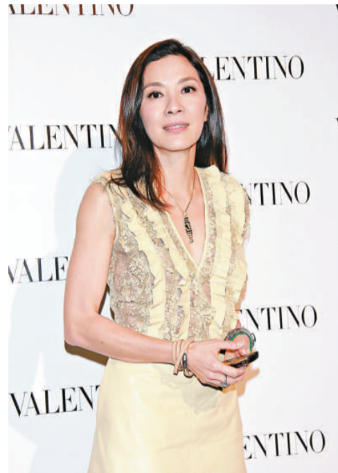
楊紫瓊稍後投入新片拍攝