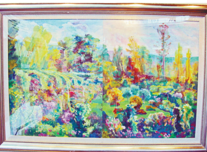
▲水粉紙本《最後一瞥（從莫奈的臥室看出去）》，是韓辛對吉維尼花園的美好回憶