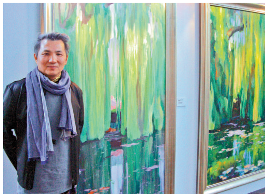
合襯托所展示的地方，他說大廈林立的香港，需要綠來點綴。

韓辛離開中國後，在美國加州大學藝術學院修讀碩士學位畢業。居美期間，他畫了一批反映當地生活的作品，近年回到中國定居北京，又去過西藏旅行，看見什麼題材，有感覺的便去畫，到哪裡畫到哪裡，他沒有限制自己一定要畫什麼，畫隨心轉。譬如受香港置地廣場委託畫的《門》系列，作品象徵着通往祖國的大門；還有兩幅描繪湖柳樹季節變化的作品，韓辛考慮的是作品是否適