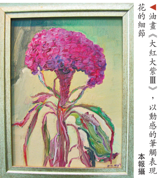
▲油畫《大紅大紫III》，以動感的筆觸表現花的細節