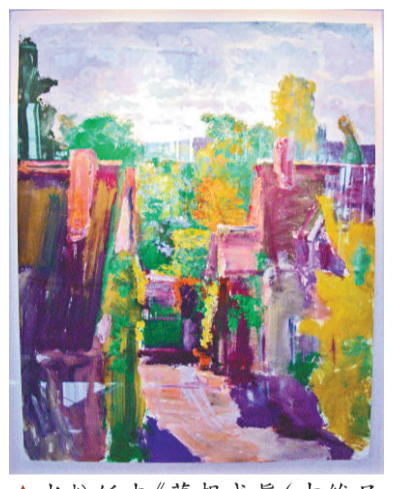
▲水粉紙本《夢成真（吉維尼）》，抒發對莫奈的欣賞之情