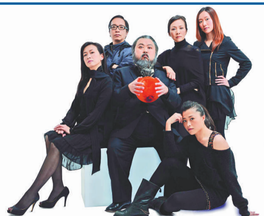
▲《找個人和我上火星》台前幕後齊做宣傳