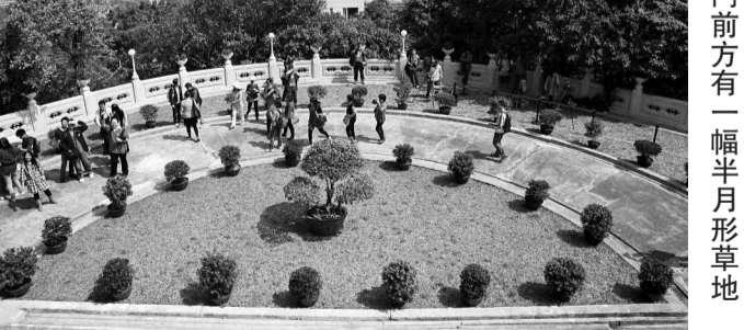
景賢里正門前方有一幅半月形草地

較特別的是車房屋頂兩個以「龍船脊」設計，汽車駛出時有「雙龍出海」的含意。車房正面上方還有一個六角形窗戶，內有圓形的太極圖案，相信是爲了保佑出入平安而設計。