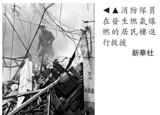
▲▲消防隊員在發生燃氣爆炸的居民樓進行救援