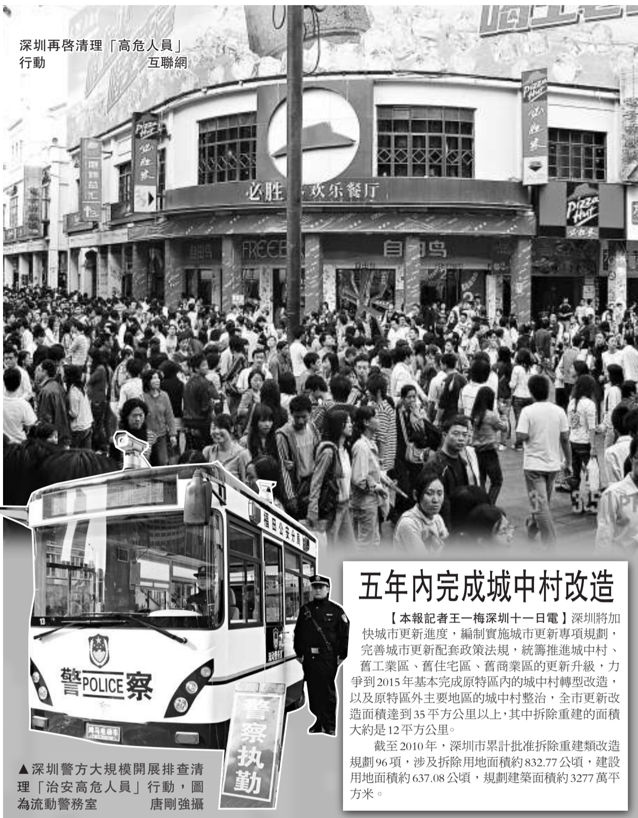
▲深圳警方大規模開展排查清理「治安高危人員」行動，圖為流動警務室

據悉，此次大運會安保行動還將打擊黃賭毒，羅湖、福田、南山等地多有港人光顧的色情娛樂場所，也將採取「零容忍」措施，從嚴處分。同時，組織全市50萬民衆，統一佩戴「紅袖章」巡邏。