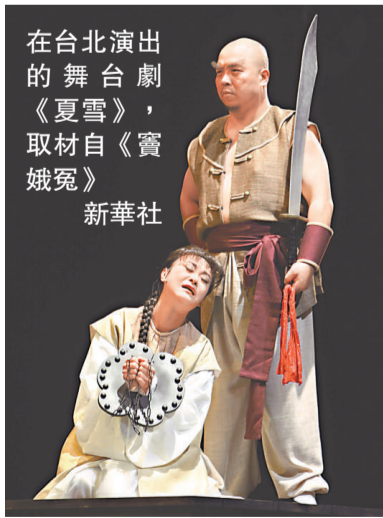
在台北演出的舞台劇《夏雪》，取材自《寶娥冤》