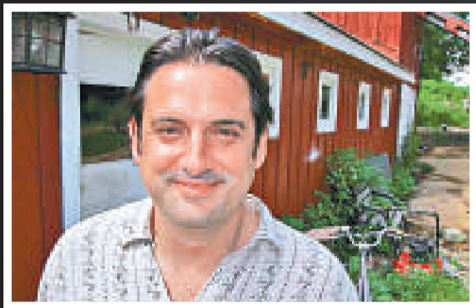
Facebook 一半股權，而且有朱克伯格寄出的電郵為證。

【本報訊】被拍成電影《社交網絡》的「Facebook爭奪戰」結果似乎已經塵埃落定。聯邦法院11日裁定，聲稱擁有Facebook原始概念的雙胞胎溫克斯沃斯兄弟敗訴，不得撤銷早前與朱克伯格定下的和解協議。不過，這場「Facebook爭奪戰」仍然充滿暗湧，因為朱克伯格的一名舊拍檔突然殺出，他聲稱朱克伯格曾同意把Facebook的一半股權分給他，並有文件為證。而雙胞胎兄弟也不甘敗訴，誓要向朱克伯格討回應得的利益。（本報記者）