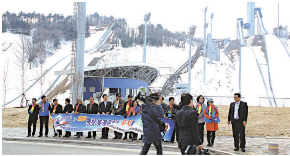
▲平昌阿爾卑斯亞齊滑雪跳台，觀眾席可容納一萬人，可作為冬奧開幕、閉幕式場地。圖為韓國團體到現場為申奧打氣

如果在冬奧會中，再創造出一位體育明星，那對經濟和國家形象的幫助就更大了。2010年溫哥華冬奧會，韓國選手金妍兒奪得女單花樣滑冰冠軍，調查顯示，金妍兒的金牌引發的經濟效應足足達到了5.23萬億韓國（約合港元376億）。這個數值相當於韓國代表團在那屆大賽上創造的6.495萬億韓國經濟價值中的80%還要多。通過那次冬奧會，韓國國家形象被提高了1個百分點，便進入全球500大企業的14家韓國企業將獲得每家公司600億韓圓（4.3億港元）的宣傳效果，韓國的內需和出口一年將增加14.8萬億韓圓（1066億港元）左右。韓國民眾的愛國熱情也是空前高漲的，