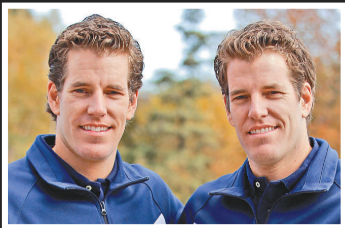
▲聲稱被朱克伯格「偷橋」的雙胞胎溫克斯沃斯兄弟上訴失敗，但仍會繼續上訴