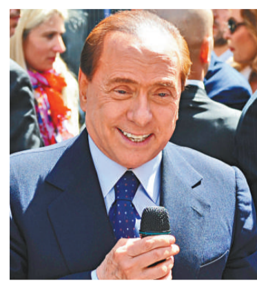
▲意大利總理貝盧斯科尼雖然醜聞纏身，但仍然談笑風生

貝盧斯科尼當天是在出席法院聽證會的時候做出這一表態的：他所擁有的電視公司涉嫌詐騙而受到起訴。不過，面對在場的200名支持者，這位麻煩纏身的意大利總理似乎並不煩惱，手裡麥克風的他還在痛斥地方法官：「不為國家着想，還專門和國家做對！」當記者問他，是否擔心被判有罪入獄時，他笑着說：「當然不，你是在做夢吧？」（英國《每日電訊報》）