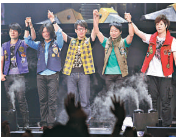
▲五月天承諾再度期加場

對於連續 4 場香港演唱會爆滿，在台灣忙於工作的五月天收到此消息，開心之餘更感激香港歌迷的支持，對於難以抽時間來港謝票也感可惜，他們更說：「如果門票還是不夠的話，我們設辦法再加場啦！」這句話再度令主辦單位傷透腦筋，努力再度協調能否有機會又再加一場，不過即使未能加場，五月天亦承諾他們每晚的演出都一定精彩，同時也會看看現場觀眾的 high 反應，就會更落力繼續唱下去。