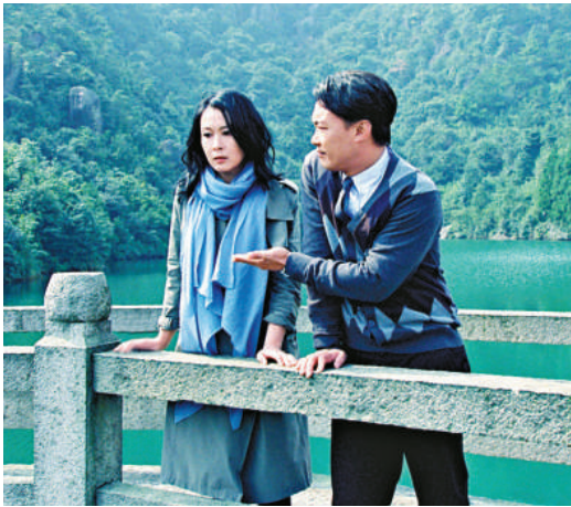
▲劉若英和 Eason 於福建的大姥山拍戲，感覺舒服

陳奕迅、劉若英（奶茶）、白冰、庾澄慶等演出《隱婚男女》即將於本周四在港上映。該片大多取景自北京，導演葉念琛和 Eason 都是愛吃之人，常常都於收工後結伴去到處找美食。Eason 提起美食便十分興奮，他說：「我們都超愛吃當地的填鴨，幾乎每天都要吃。」