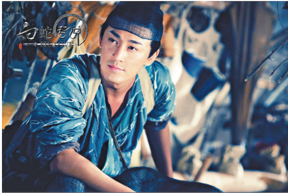
▲林峯演許仙，真是一個帥樣 ▼林峯拍攀岩戲，拍到不幸掛彩