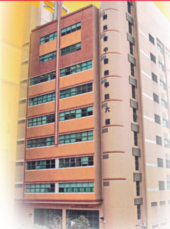
浸大首創中醫健管碩士課程

2011年4月2日，在香港浸會大學中醫藥學院孔惠紹博士伉儷講堂舉行了碩士學位課程介紹會。在會上，我代表「健管碩士課程」管理委員會，向與會者對這一