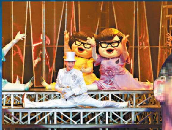
▲學友這個一字馬，可謂「技驚四座」