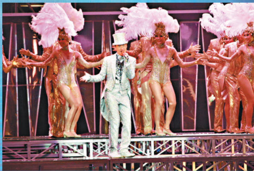
▲學友載歌載舞 ▶學友歌悼好友