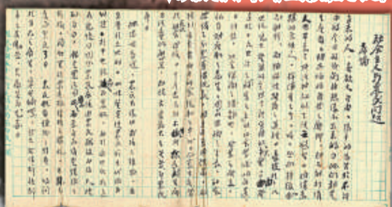
▼彭素民著作《社會主義與農民問題》