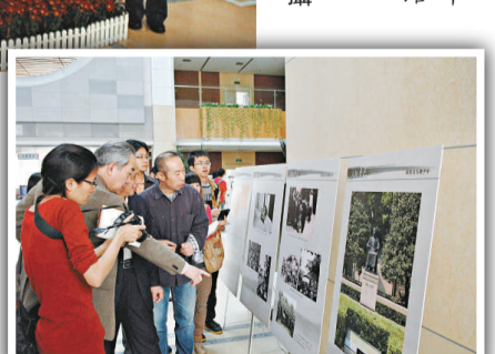
▲「人間魯迅」展吸引眾多市民參觀

、張揚哲、周正扶等「暨大」學生。楊陽認為，今年九月二十五日是魯迅誕辰一百三十周年紀念日，在魯迅曾經生活工作過的地方廣州舉辦這樣的展覽非常有意義，此次展覽以林賢治的傳記作品《人間魯迅》書名為題，展示魯迅平凡而偉大的一生，力求還原一個真實的魯迅。此次展覽以六十個展板上三百多幅圖片展示了魯迅豐富多彩的一生，圖片回顧了魯迅從童年、青年、中年及去世前的生活狀態，包括魯迅祖父母、父母的照片，魯迅在仙台求學期間照片及成績單，魯迅文學創作歷程、魯迅與左翼作家們的聯繫、魯迅與許廣平的第一次通信信件照片以及魯迅去世後巴金等十六人為魯迅扶靈、過萬人送別魯迅的盛大場面等。展覽五月七日結束。