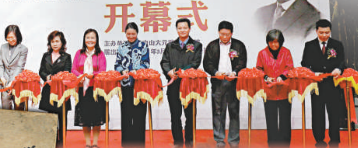
▲江西萍鄉縣開國前革命本末(封面)