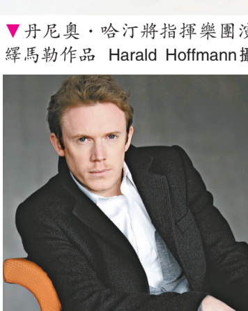
▼丹尼奧·哈汀將指揮樂團演奏馬勒作品

【本報訊】由指揮大師阿巴度創立的馬勒室樂團（Mahler Chamber Orchestra），將以七十人陣容首度訪港，舉行一場全馬勒曲目的音樂會，以紀念該作曲家逝世一百周年。