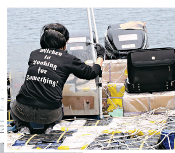
▲水警檢獲的走私電腦硬盤