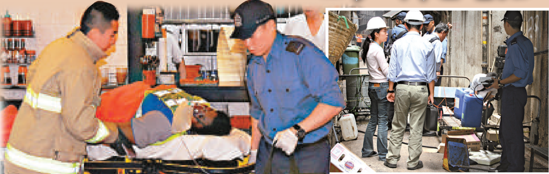
▲發生混合清潔劑爆炸事件的灣仔謝斐道一間餐廳的後巷

後巷傳出爆炸巨響，又四散一陣刺鼻臭味，附近茶餐廳食客被嚇紛紛結帳離開，一名南亞裔女工與同事趕往後巷查看，只見一片凌亂，四名工人全部跌倒在地，後巷充斥刺鼻臭味，大片地面均沾滿黃色鹽晶粉末，大驚報警求助，並將傷者扶進餐廳內休息等候救援，