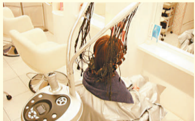
電髮技術日新月異，所用的儀器和捲髮芯不斷推陳出新

現今上髮型屋電髮，單看價目牌上的各種名堂——日式電髮、陶瓷曲髮、數碼曲髮、錫紙曲髮等等，已教人眼花繚亂。單是燙髮已有這麼多選擇，現代女性實在幸福。3000年前的古埃及婦女要電髮，是把頭髮捲在木棒上，塗上含有大量硼砂成分的泥，在太陽底下烘曬，待泥乾後洗掉，頭髮便呈現鬻曲。不過，這種最早出現的電髮方式當然有其缺點，就是鬻曲的效