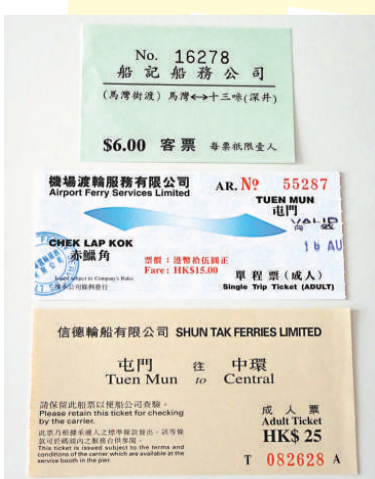
▲已停辦的渡輪航線船票

大海是香港最大的自然資源，在未有海底隧道（1972年建成）的年代，渡輪是來往香港島和九龍半島的唯一交通工具，對民生的影響不小。1966年天星小輪頭等加價5仙竟引起市民示威而導致警民衝突，政府要實施宵禁，駐港英軍甚至出動裝甲車巡邏。渡輪的重要性