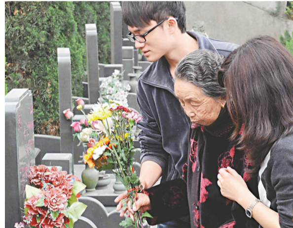
清明節是中國重要傳統節日之一

學生童言無忌地問：清明時節為什麼不是雨紛紛？清明是中國農業社會二十四個節氣之一，由於香港位於大陸南部沿岸，所以當季候風於4月吹過中國大陸的時