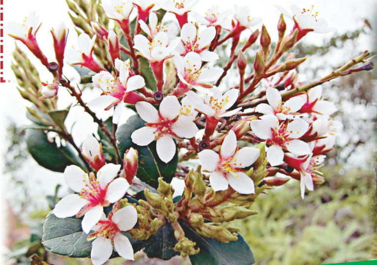
▲純樸的大澳漁村風貌