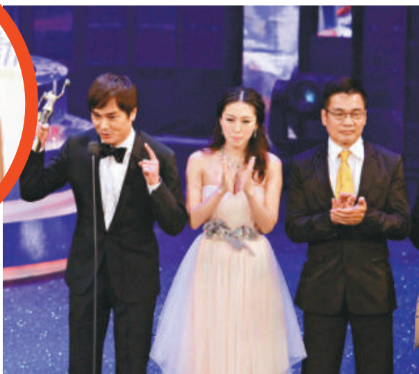
▲亞視播金像獎頒獎典禮，無線公布收視只得七點

亞視今年直播金像獎頒獎典禮，不過根據無線公布的收視資料顯示，當晚平均收視只得七點，最高收視十點，亞視就不相信有關收視結果，認為無線以固定不變的六百五十戶採樣是不可信，更質疑無線以「虛假」收視結果來攻擊亞視，事後令到負責有關收視調查的 CSM (媒介研究) 極度不滿。昨日 CSM 更聯同無線及香港廣告商會一起發出聯合聲明，認為亞視所指的「虛假」是毫無根據及嚴重的指控，有損機構(媒介研究)的聲譽，他們深表遺憾，亦保留追究權利。