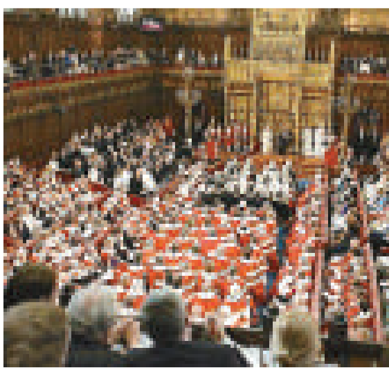
▲英國上議院擠迫不堪 互聯網

倫敦大學的報告還指出，卡梅倫必須下令暫停新的議員任命，把上議院的議員人數控制在750人以內。報告建議，上議院議員最高任期不能超過15年。（綜合報道）