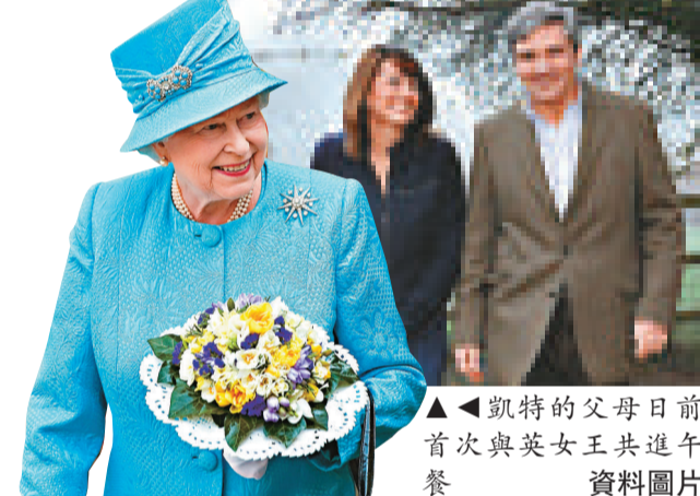
▲凱特的父母日前首次與英女王共進午餐 資料圖片

據報道，在婚禮當日，威廉王子和他的伴郎將會被「關進」聖埃德蒙德的一個小禮拜堂裡，直到凱特11點進入教堂前幾分鐘才能被放出來。由於媒體將對婚禮進行直播，包括凱特穿著禮服從她下榻的酒店到西敏寺一路的情況，所以威廉的屋子不會有互聯網、電視和其他通訊設備，保證凱特能給威廉一個驚喜。也正因此，威廉可能是世上最遲看到凱特婚紗的人。