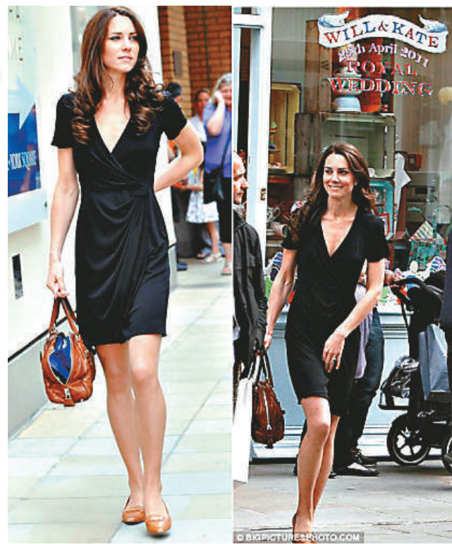
▲凱特日前好好把握婚前的自由日子，在倫敦街頭享受購物之樂