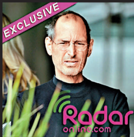
▲喬布斯現身蘋果總部，面容憔悴 互聯網