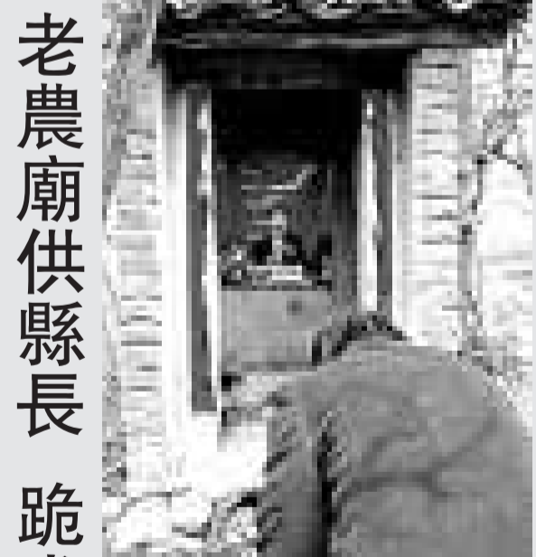
▲網友發出的老人供奉縣長照片

據悉，廣東省物價局小金庫窩案於2009年12月東窗事發。目前，本案在進一步審理中。據了解，馬雲涉嫌貪污一案，也將於25日在廣州中院開庭審理。