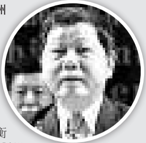
▲深圳原市長許宗衡

【本報記者楊家軍鄭州二十一日電】深圳原市長許宗衡受賄案一審今日在河南省鄭州市中級人民法院開庭審理，許被控受賄3318萬元，這一數字與內地媒體早前指其貪賄20億元的報道相差甚遠。據媒體報道，許宗衡一向以言論大膽著稱，曾對媒體表示要做「一個清廉的市長，不留敗筆，不留遺憾與罵名」，但他的人生制高點終結在了54歲，許宗衡選案連深圳三名副市長和本港知名女星。