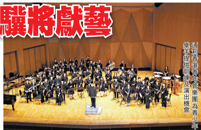
▲美籍華裔薩克管演奏家謝德驥曾在世界許多地方演出

謝德驥今次來港將與本港管樂手合作，演奏美國當代管樂作曲家朗尼爾森的《舞蹈隨想曲》。謝德驥是國際知名薩克管樂手之一，一九九六年他以紐約國際藝術家比賽優勝者的身份在卡奈爾音樂廳演出，曾被紐約時報稱為「一位年輕的音樂大師」。之後他以獨奏者身份活躍於五大洲，曾與德蒙交響樂團、美國海軍樂隊、斯洛文尼亞管樂隊、西班牙 La Armonica 樂團、泰國管弦樂團、香港小交響樂