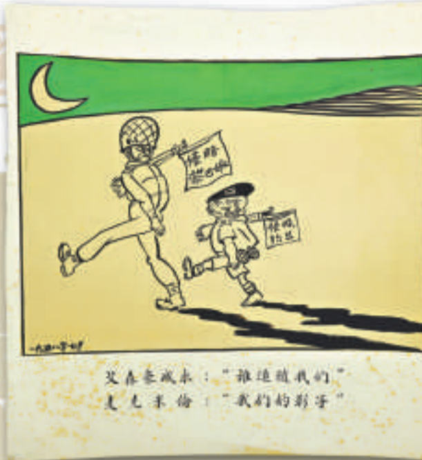
▲《侵略黎巴嫩 侵略約旦》