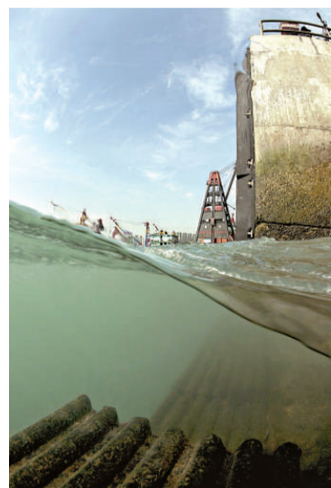
▶ 在西九龍海濱長廊拍攝的圖像