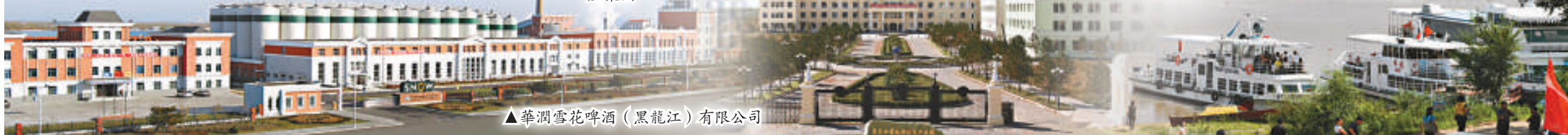
▲華潤雪花啤酒（黑龍江）有限公司