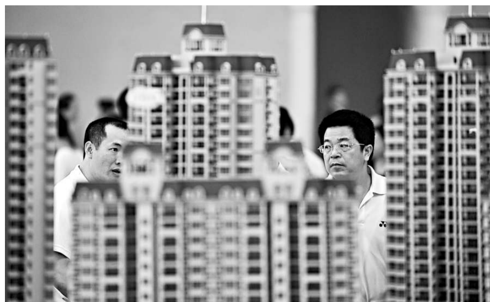
▲經濟學家華生表示，徵收財產稅能有效调控樓市。圖為南寧市民在觀看樓盤模型

比如在交易環節，中國採取的辦法是徵收交易額的1%，這放行了高額的財產性收益。而日韓的做法是區分自住和非自住，對非自住房按交易差價徵收財