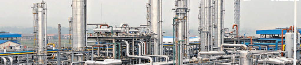
山西省潞安集團煤油循環經濟園 資料圖片

「今後，我們加強主體責任，加強管理力度，加大機械化和信息化的程度，使挖煤不再付出生態的代價和生命的代價，這也是以人為本，也是民生，也是發展，所以我們講，發展是第一要務，安全也是第一要務。這是山西特色，和其他省不一樣。」袁純清說。