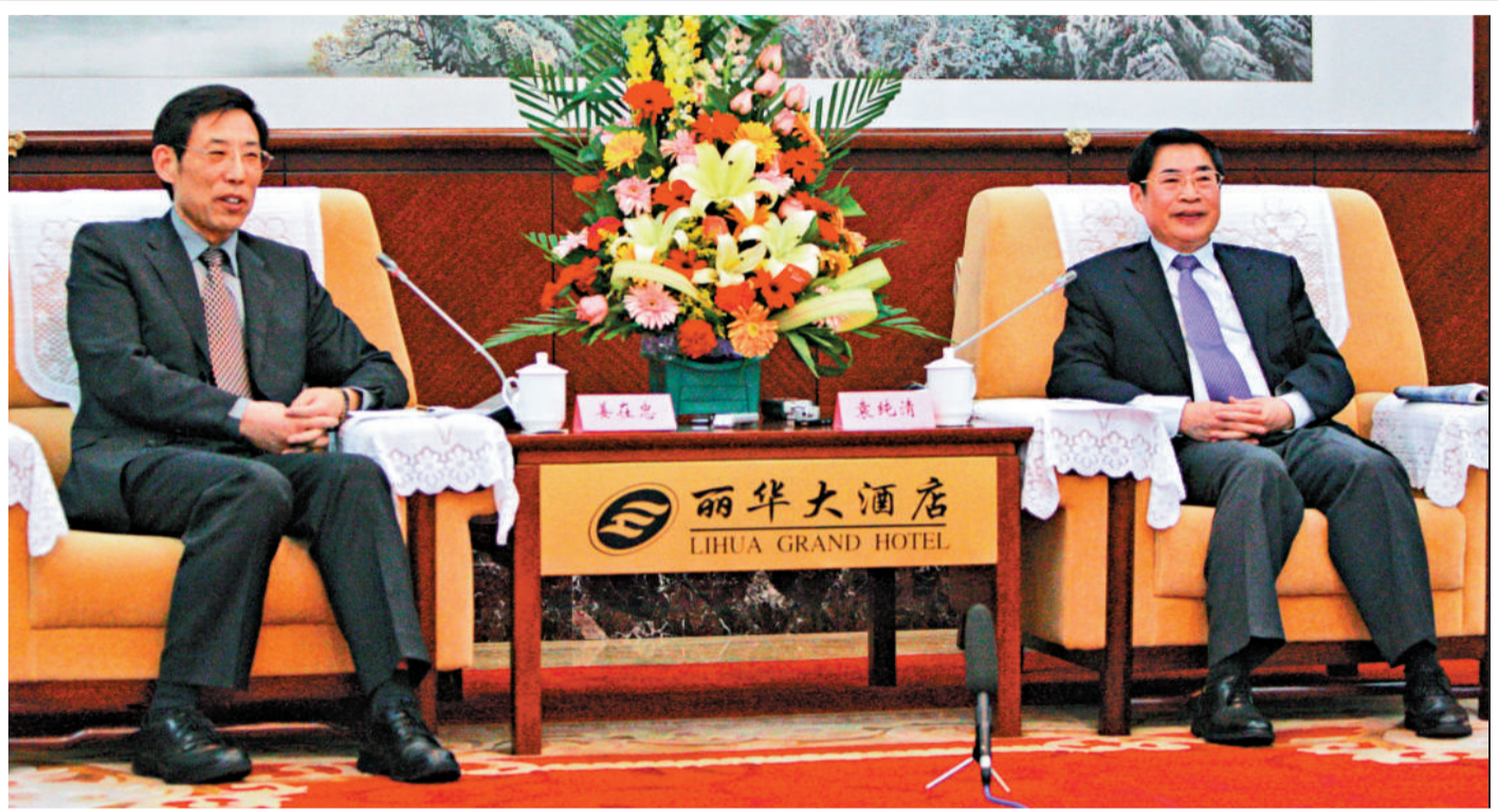
▲山西省委書記袁純清（右）會見香港媒體高層山西探訪團。圖為袁純清和大公報董事長兼社長姜在忠（左）會談 任靈杰攝

山西致力引入對裝備製造、現代煤化工、新型材料、物流、文化、旅遊等新興產業的投資。圖為山西著名旅遊景區平遙古城 資料圖片