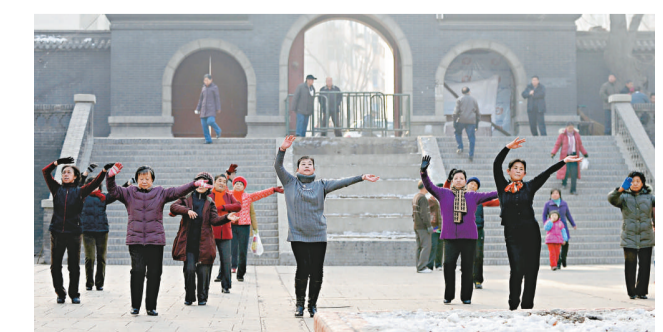
▲市民在太原市迎澤公園跳舞 資料圖片

姜在忠表示，大公報將發揮在香港和內地之間的窗口和橋樑作用，大力宣傳和報道太原，促進太原和港澳地區的聯繫。