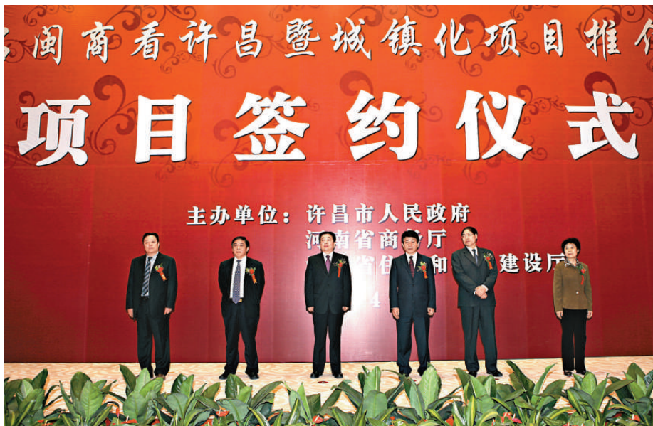
▲許昌合作項目簽約儀式