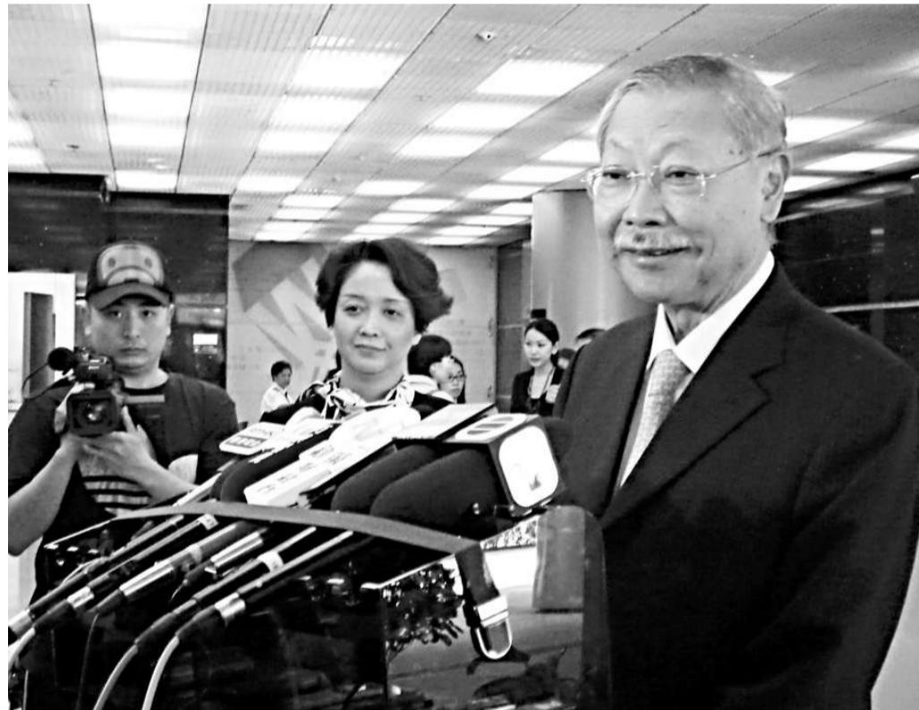
▲孫明揚證實患有腎衰竭，表示現時身體功能正常，會繼續餘下任期

曾蔭權讚揚孫明揚，有豐富工作經驗，做事一絲不苟、盡心盡力，有很強的判斷力，是難得的專業人員。他說，政府官員壓力大、工作繁重，要管理一個大機構需要能力、魄力和操守，他與教育局的同事會