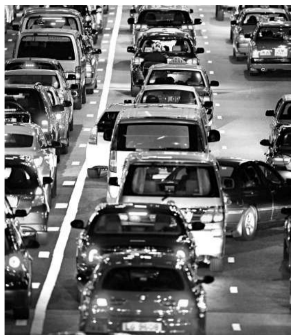
▲運房局稱暫時不會對汽車加稅法案作任何修改或豁免