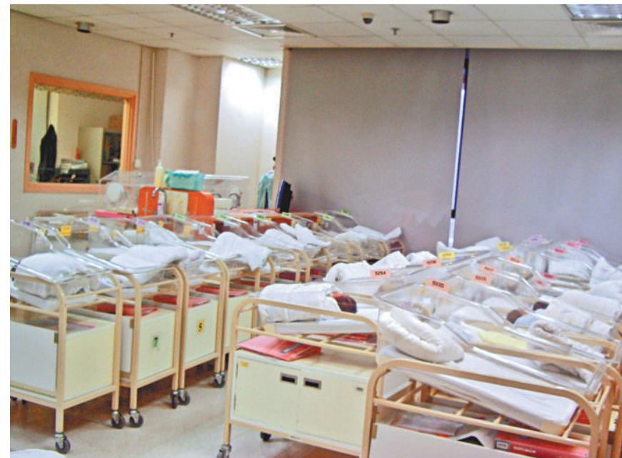
▲本港產科和初生嬰兒深切治療部服務已瀕臨崩潰邊緣 資料圖片

至於如何協助內地婦女在香港所生兒童讀書和生活問題，政府表示，將會在交通服務、社會福利等多方面提供協助。