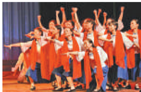
▲一系列紅色經典將集中在北京的舞台上演，慶祝中共建黨90周年 資料圖片

音樂廳、歌劇院、人民大會堂舉辦，它們分別是國家大劇院詠劇中國五一音樂會、大型情景經典音樂舞蹈《紅軍哥哥回來了》、慶祝建黨90周年獻禮演出之一「我的祖國」人民大會堂名家名作大型交響演唱會。