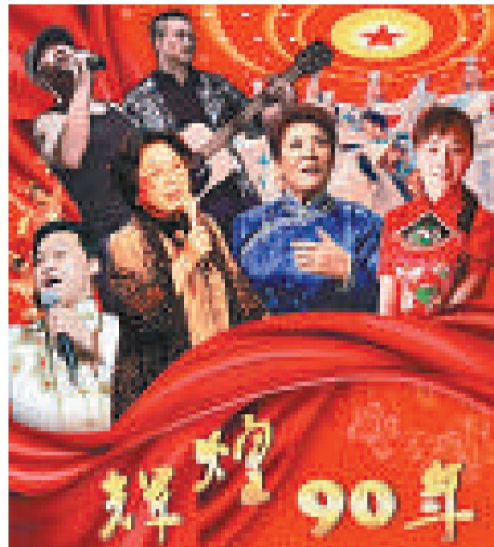
▲慶祝中共建黨90周年活動宣傳海報

除了「五一」的大型演出之外，紅色經典會以各種形式在五月得到延續。5月7日，迎建黨九十周年——泛海情大型交響音樂歌劇《江姐》將在人民大會堂與人們見面，重溫英雄故事、傳承紅岩精神。15日，人民大會堂還將上演「最美的歌唱給媽媽——蔣大為紅色經