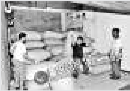
▲倉庫內存放着大量的「毒花椒」 重慶晚報

【本報訊】據中通訊社重慶29日報道，重慶質監局檢測出某品牌火鍋底料、麻辣魚底料中含有害物質「羅丹明B」。經檢測，確定為花椒染毒，劣質花椒被人為染毒後混入了正品花椒中。目前，警方已經查封上萬斤涉案毒花椒，涉事商販已被刑拘。所幸，由於該批底料處於送檢環節，並未上市銷售。