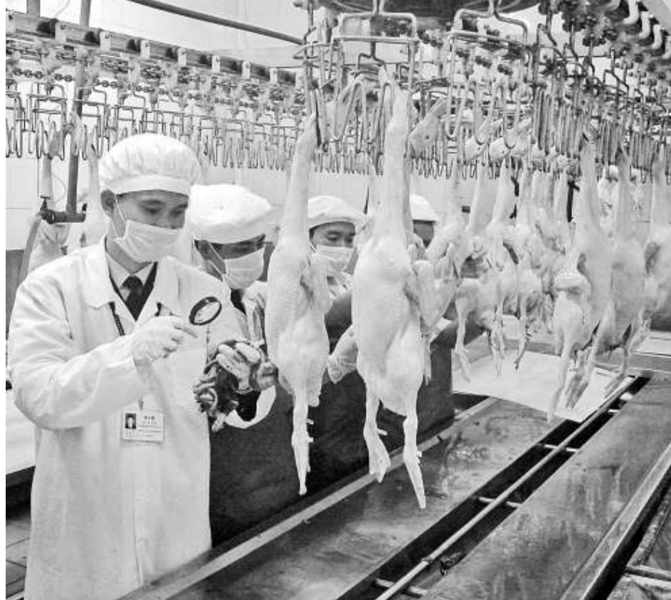
▲廣東檢驗人員抽驗輸港家禽

三、加強風險監測，防範安全隱患。嚴格執行廣東局2011年進出口食品質量安全風險監測計劃，根據當地實際，結合衛生部發布的47種可能在食品中「違法添加的非食用物質」、22種「易濫用食品添加劑」和82種「禁止在飼料、動物飲用水和畜禽水產養殖過程中使用的藥物和物質」名單，在風險分析的基礎上適當調整監