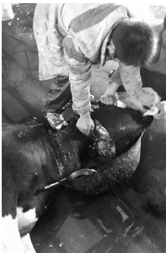
▲河北的一家定點活牛屠宰廠裡，正在屠宰活牛