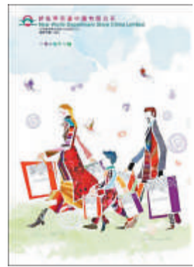
▲新世界百貨2010財政年度年報，榮獲「封面—藝術（圖像／插圖）」組金獎

以「創高峰 建佳績」為主題，新創建集團的2010財政年度年報強調集團致力追求長遠增長的決心。 年報封面以兩大片紅色及橙色的浮凸拼圖，象徵集團基建及服務兩大核心業務，整份年報亦以拼圖貫穿，意取業務發展猶如拼圖，同樣需要準確拼接才能展現成果。 新世界中國地產的2010財政年度年報則以漢字小篆寫成的「家、商、樂、悠」四字作封面圖像，呈現出濃厚的中國古典文化氣息。 新世界百貨2010財政年度年報的封面以色彩繽紛的拼貼圖案描繪一家大小熱鬧歡欣地在百貨店內購物的情景，並在其上灑上金粉，配以飛躍的蝴蝶和各款潮流商品作點綴，予人春意盎然、可無拘無束地盡情購物的感覺。