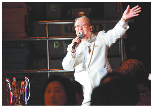
▲香港域多利獅子會會長任正冊爵士日前出席多項慈善活動，積極推廣舞運及公益籌款工作，分別在舞蹈界及獅子會熱心推廣公益，忙得不亦乐乎。

香港域多利獅子會會長任正冊爵士日前出席多項慈善活動，積極推廣舞運及公益籌款工作，分別在舞蹈界及獅子會熱心推廣公益，忙得不亦乐乎。