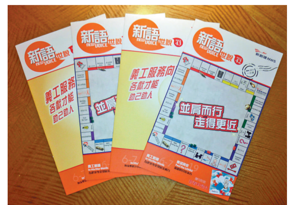
▲新創建集團員工刊物《新語世說》，榮獲「僱員刊物：員工刊物」組銅獎