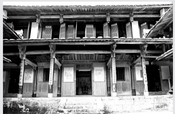
▲紅四軍軍部和朱德宿營的「美魁堂」。