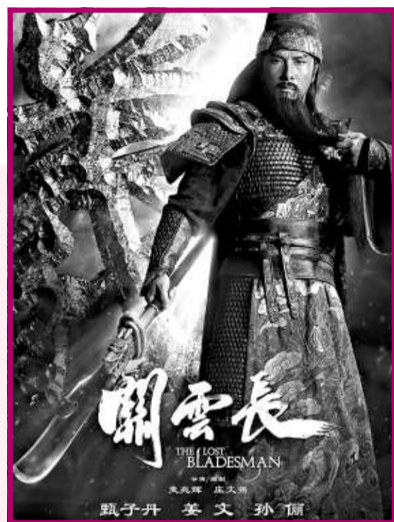
甄子丹 姜文 孫俪