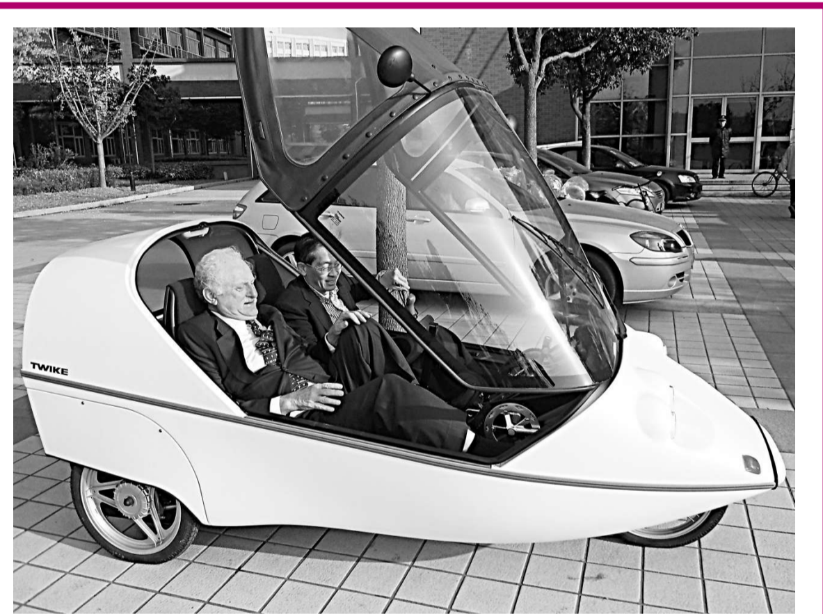
▲內地首台自主研发的「人電混合動力車」在上海交大先進產業技術研究院誕生。

同時，對文化作品和歷史人物的評判皆是個人觀點，言論自由，大家都可以發表觀點，無法從法律上規定人們對一個歷史人物的界定，也很難讓大眾對一個歷史人物的認知達到一個共識。至於網友「關雲長後人」所受的傷害，不屬於法律意義上的侵權，也不能代表「3500萬山西人」去起訴。