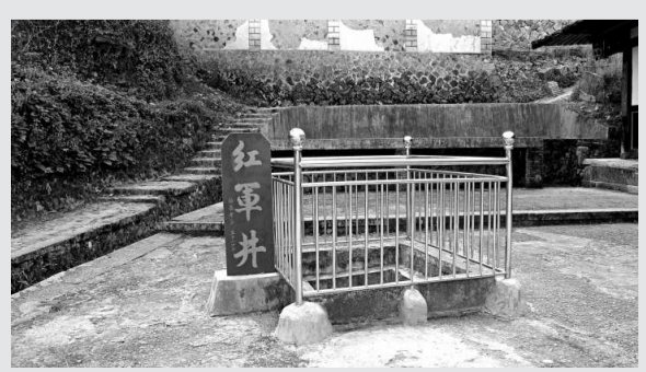
▲當地樹碑紀念的「紅軍井」。