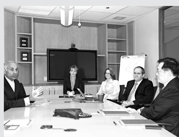
▲周一嶽（右）與加拿大醫療資訊協會管理層會面

人們彎腰、轉身，都要靠椎間盤支撐。張文智指，椎間盤是在脊椎骨之間的啞啞狀物體，有避震和保護神經功能。一旦「啞啞」消失，即椎間盤退化，脊椎骨表皮受壓和撕裂，壓着神經線導致腰痛。退化主要原因除超重和癩肥，還有年齡漸長、做彎腰等不當姿勢和基因問題。