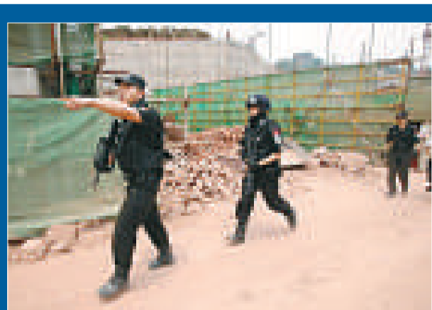
▲重慶江北區特警隊員開入黑工地，拘捕聘用黑保安的工頭，促成工人欠薪問題解決