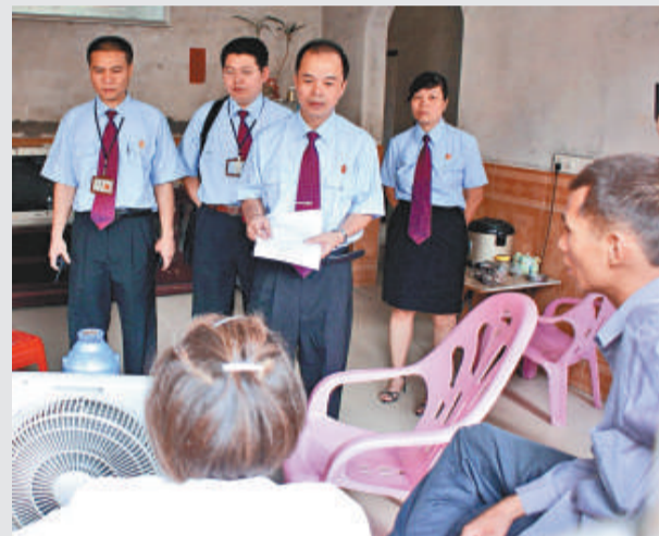
▲針對婚外情等家庭案件，廣東試點「家事審判合議庭」的法院將加強當地居委會、婦聯等聯合調查取證

【本報記者方俊明廣州五日電】近年來，廣東的離婚案呈增多趨勢，而當中涉及婚外情的比例佔逾三成。廣東省高級法院今天透露，東莞、中山等珠三角城市的離婚案，跟第三者有關的更超過了五成。全省試點「家事審判合議庭」一年多以來，七家試點法院協助離婚案調查取證涉及第三者案件的比例也在增加。