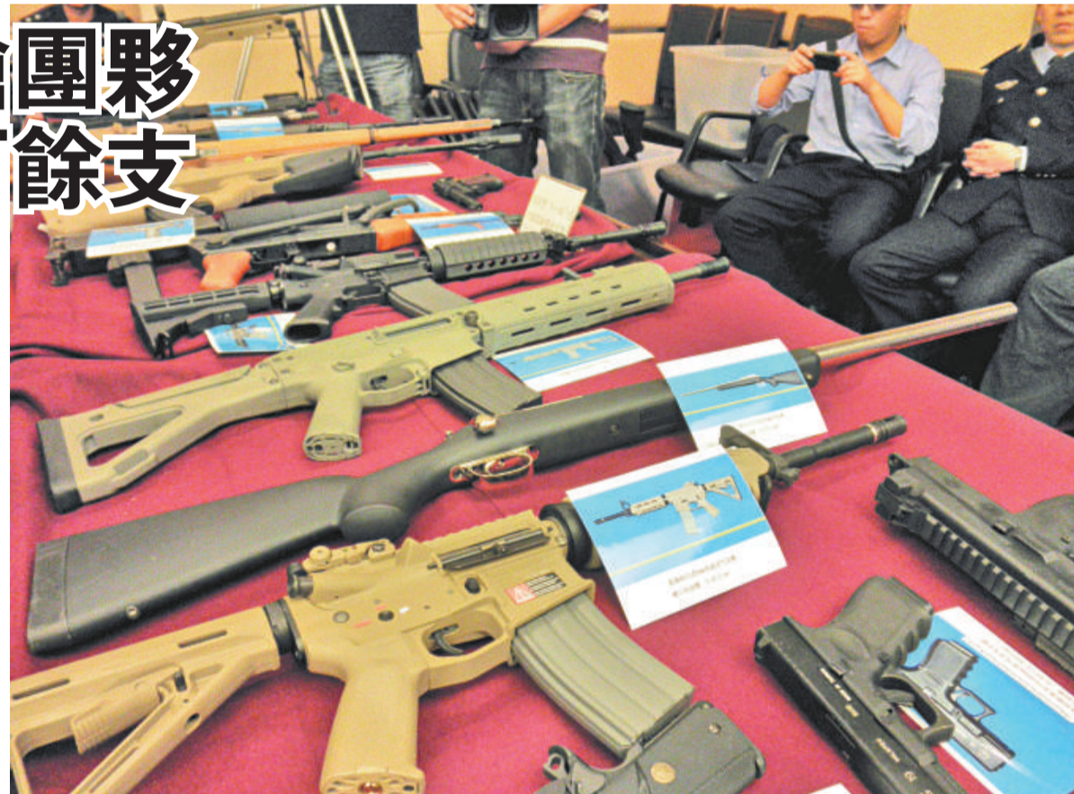
▲當前廣東涉槍犯罪活動突出，槍擊案頻發，警方開展專項行動嚴打。圖為繳獲的百餘支「仿真槍」

經審查，邱×從2008年9月開始通過某互聯網站，多次將槍支從澳門走私入境，再通過互聯網和物流渠道非法販賣；今年8月，邱×結識胡×後，又合謀從事非法販賣槍支的活動。截至目前，共追繳槍支171支。