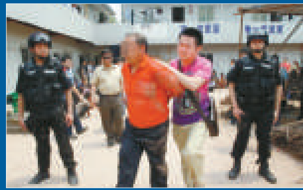
▲警方捉獲多名「工地打手」