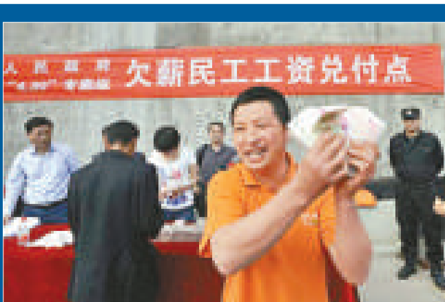
▲被拖欠工資的農民工獲發欠薪，喜出望外