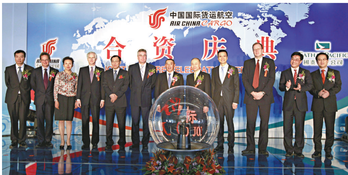
▲國航與國泰高層在北京見證國貨航開業

終於完成合資後，國航仍會持有國貨航51%的多數股權，國泰則持有25%的股權及24%的經濟權益，新合資公司會以上海為主要運營基地，機隊規模亦會短期內增至12架波音747-400型貨機。國貨航以往是以北京和