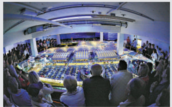
▲德國漢堡新設立的微縮模型 Knuffingen 室內迷你機場舉行開放日

最令人稱奇的是，跑道上停着的 40 架飛機還能利用跑道末端的電路製造出起飛的效果；而當飛機降陸之後，還會有小小的梯從艙門口垂下。到了晚上，模型機場上的所有燈光都會亮起。