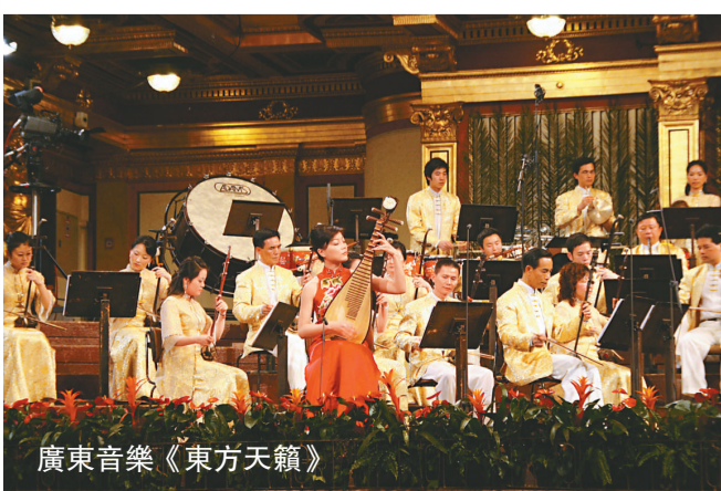
廣東音樂《東方天籟》

門票現於各城市電腦售票處發售。節目詳情可參閱於康文署轄下表演場地備取的第五十七期《展影》。查詢可電二七三九二一三九，網址：www.filmarchive.gov.hk 或 www.lcsd.gov.hk/fo。