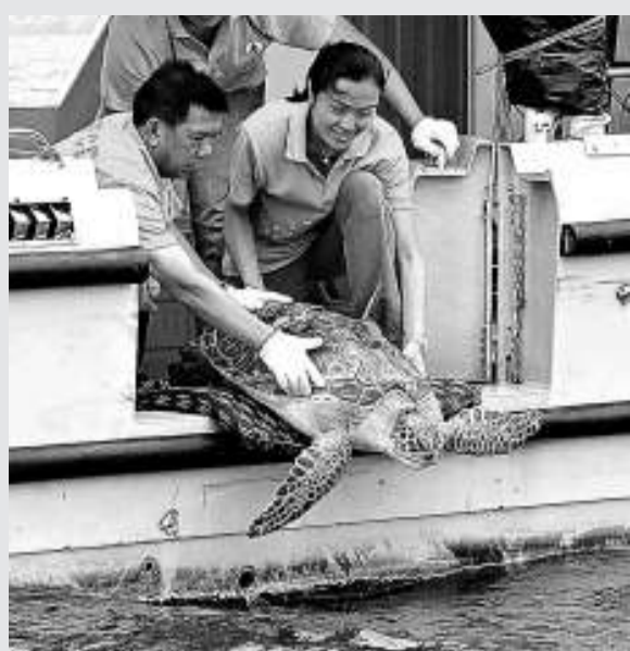
▲漁護署將綠海龜放回大海，靠龜背上的衛星追蹤器，每日緊貼牠們的行蹤、潛泳次數和時間