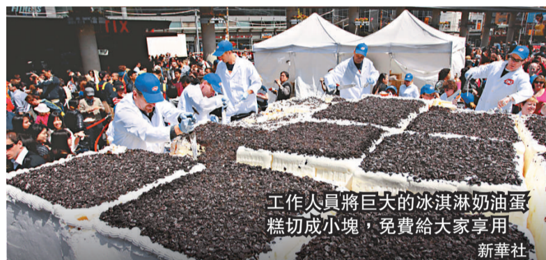
工作人員將巨大的冰淇淋蛋糕切成長條，免費給大家享用

現年 51 歲的羅西是瑞士空軍退役飛行員，多次上演空中飛行特技。2008 年 5 月，他借助自己研製的噴氣動力翼在瑞士沃州飛越阿爾卑斯山，同年 9 月飛越英吉利海峽。