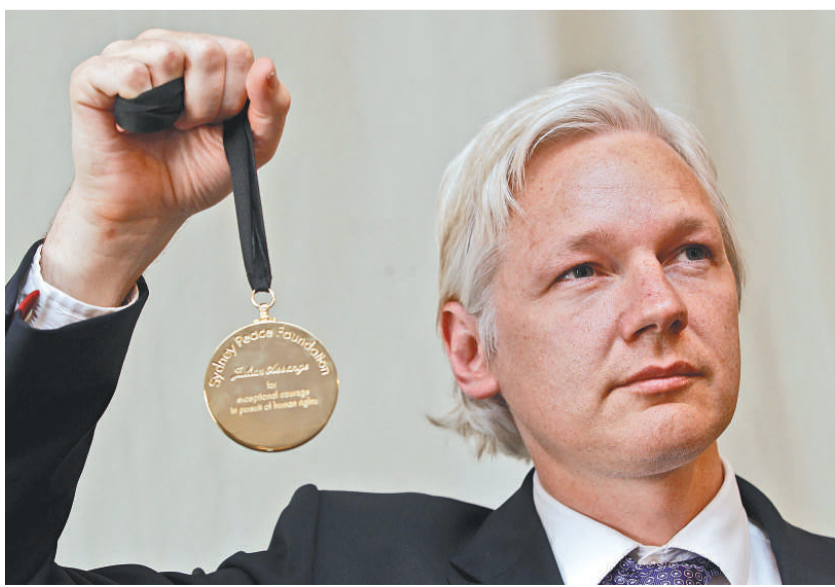
▲阿桑奇手持澳洲「悉尼和平基金會」和平獎勳章

「維基解密」網站成立於 2006 年，現年 39 歲的網站創始人阿桑奇表示，創辦「維基解密」的目的是揭露政府和企業的腐敗行為。2010 年，「維基解密」網站因為披露了 25 萬份美國外交密件而引發了「外交地震」，該網站及其創始人阿桑奇頓時成為全世界注目的焦點。美國政府指責「維基解密」的做法是不負責任的，並表示將通過運用廣泛的法令追究阿桑奇的刑事責任。美國一些政客認為應將「維基解密」歸類為國際恐怖組織。