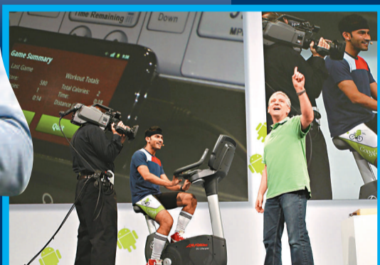
▲谷歌技術高管展示 Android 系統和單車的互動