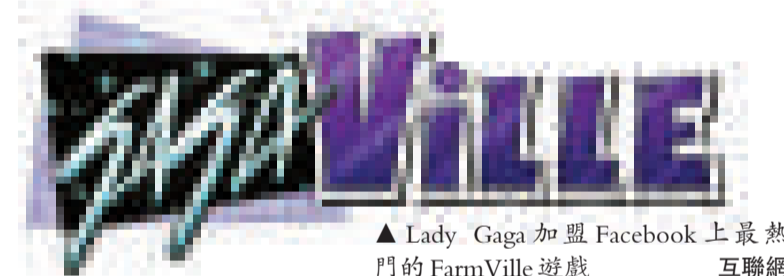
▲Lady Gaga 加盟 Facebook 上最熱門的 FarmVille 遊戲 互聯網

這個超級奶油冰淇淋蛋糕製作團隊負責人丹尼斯·胡頓在現場向媒體介紹說，超級蛋糕的製作歷時數月，共有近百名專家和志願者參與，主要的消耗為 20000 磅冰淇淋、200 磅鬆糕和 300 磅巧克力等。完成秤重後，這個超級蛋糕被十數名工作人員踩着梯子當場切割，免費派發給現場的觀眾享用。