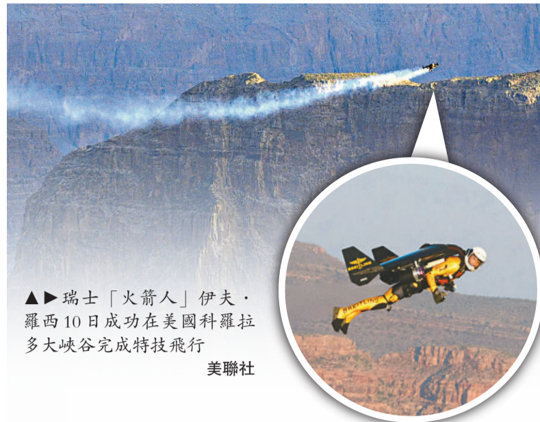
▲瑞典「火箭人」伊夫·羅西 10 日成功在美國科羅拉多大峽谷完成特技飛行